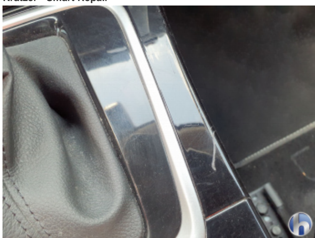
3. Mittelkonsole Innenraum vorne mitte Gebrauchsspuren - Ohne Reparatur