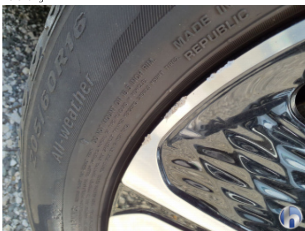
1. Felge Vorne - Rechts Kratzer - Smart Repair