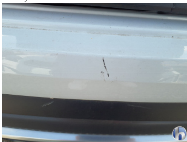
2. Stoßfänger Hinten Kratzer - Smart Repair