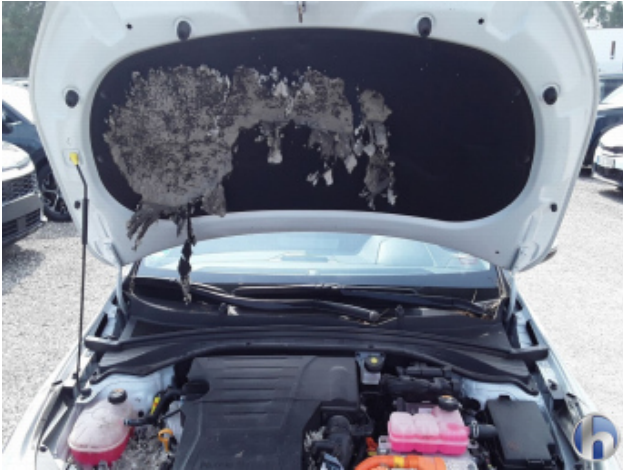
3. Motordämmmaterial Beschädigt - Erneuern