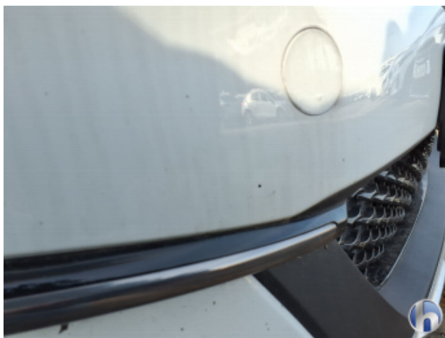
3. Stoßfänger Vorne Gebrauchsspuren - Ohne Reparatur