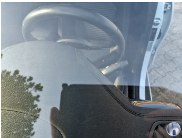
2. Windschutzscheibe Gebrauchsspuren - Ohne Reparatur