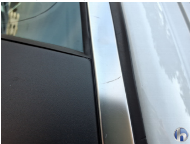
5. Zierleiste Tür li.vo. Gebrauchsspuren - Ohne Reparatur