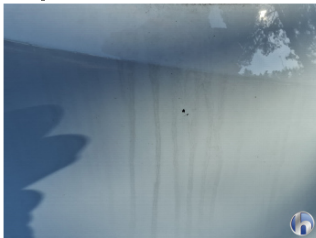
1. Seitenwand - Hinten - Rechts Gebrauchsspuren - Ohne Reparatur