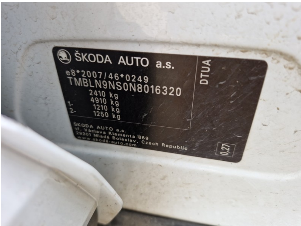
VIN / výrobní štítek