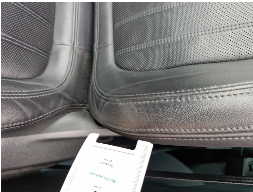
7 Potah opěradla sedadla řidiče - Opotřebení Umístění: Interiér (vnitřní prostor)