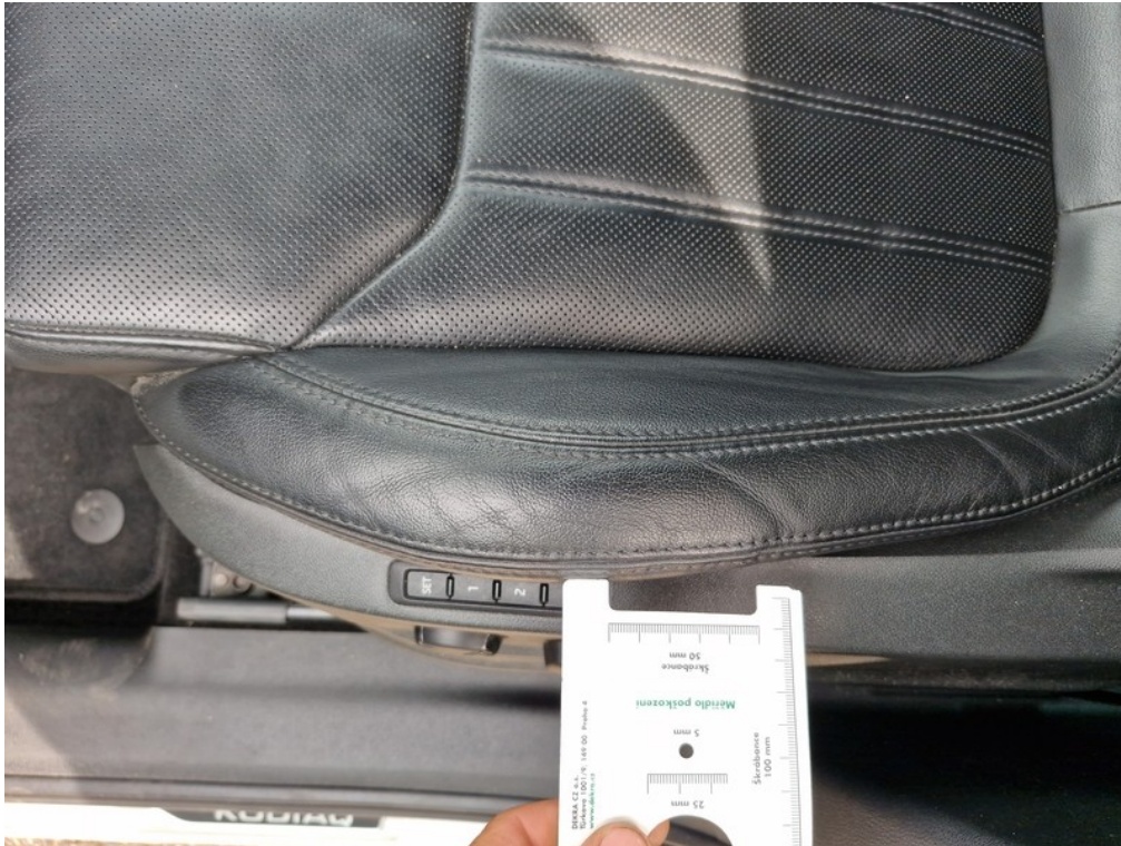
6 Potah sedáku sedadla řidiče - Opotřebení Umístění: Interiér (vnitřní prostor)