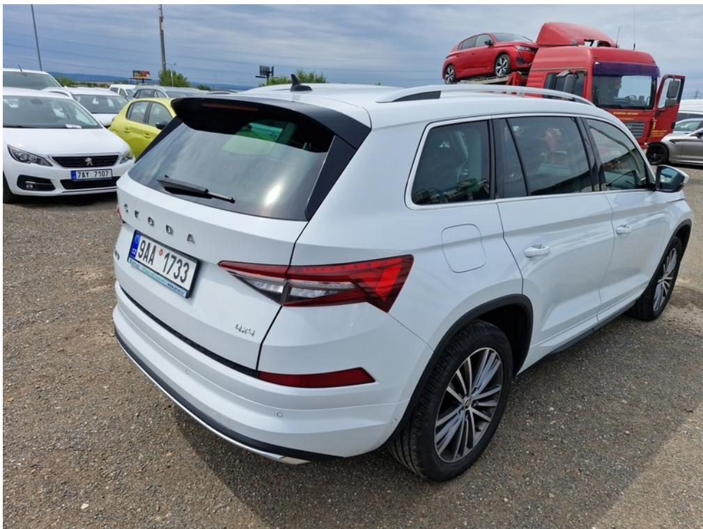
Pohled zezadu zprava