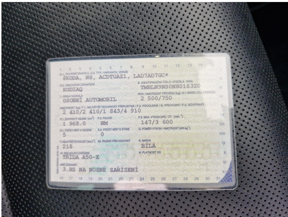
ORV č.l. str.2