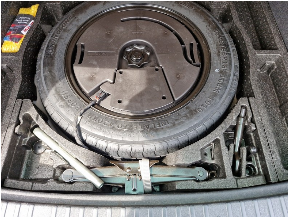
Rezervní kolo / sada na opravu