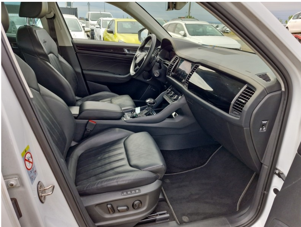
Interiér z pravé strany