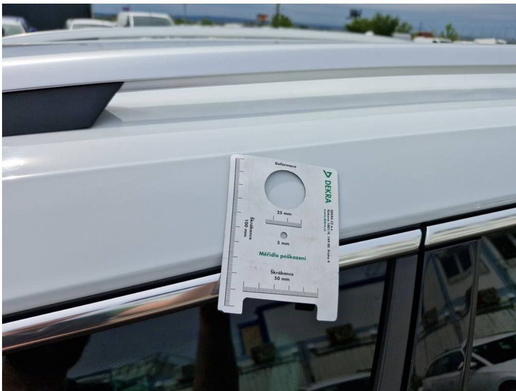
Viz popis k poškození č. 4