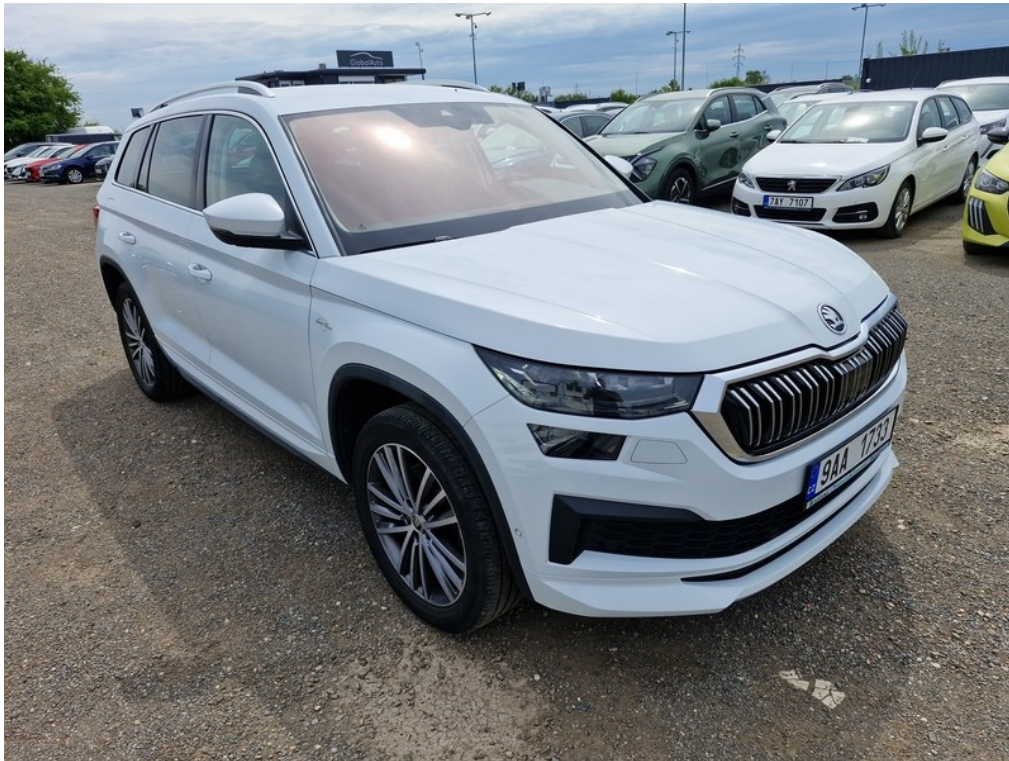
Pohled zepředu zprava