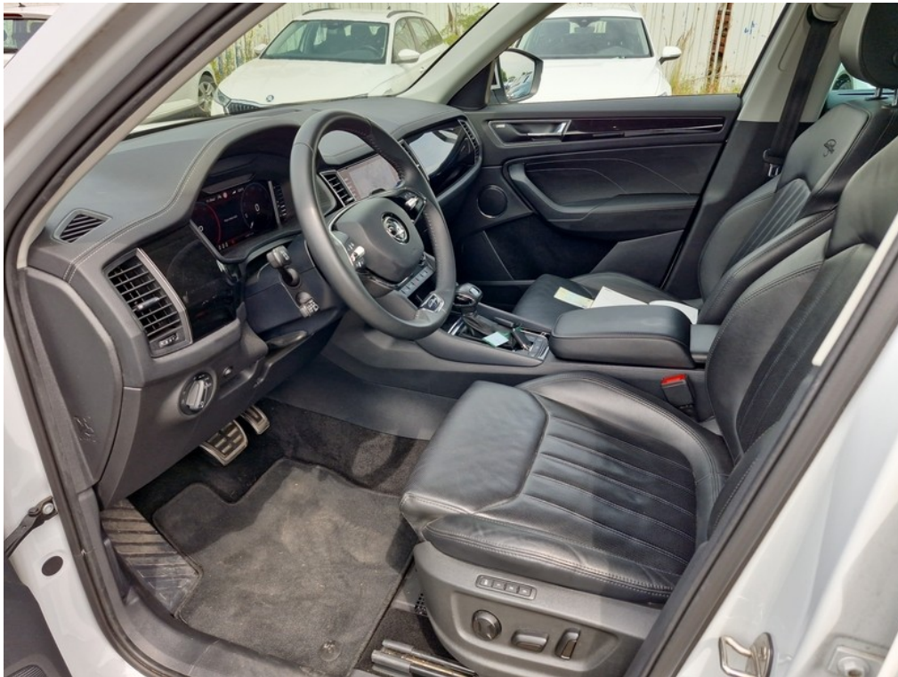
Interiér z levé strany