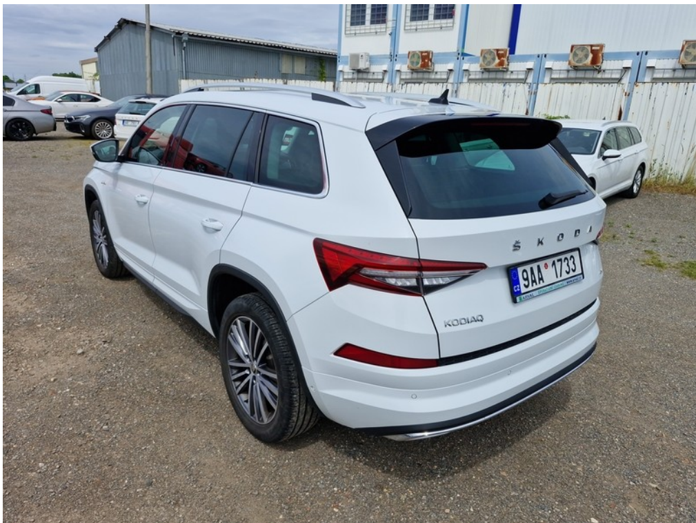
Pohled zezadu zleva