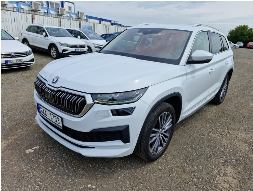
Pohled zepředu zleva