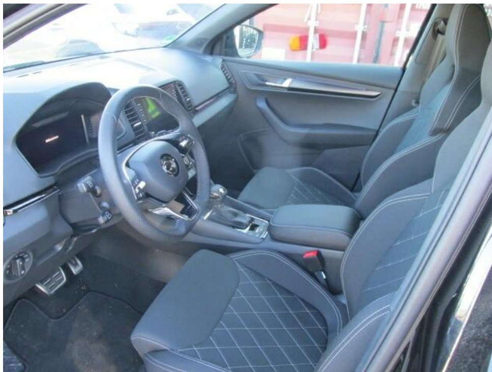
Bild 8 : Durch geöffnete Fahrertüre: Fahrersitz, Armaturenbrett und Schalthebel