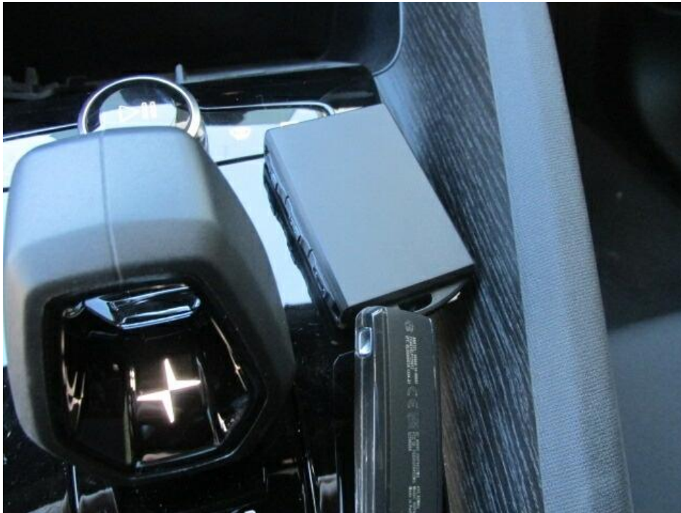
Bild 13 : Fahrzeugschlüssel nicht vollständig ( Schließsatz erneuern).