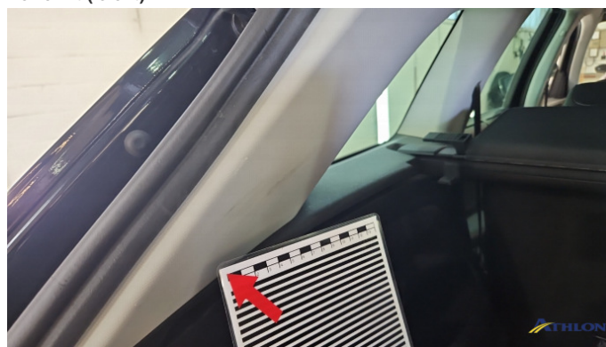
9. Kofferraum Gebrauchsspuren