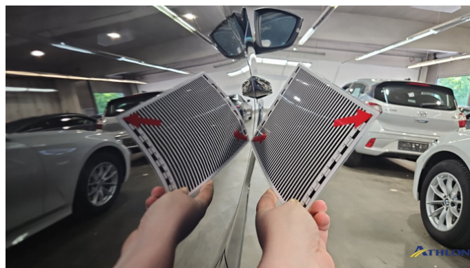
7. Tür Hinten - Rechts Verformt (leicht)