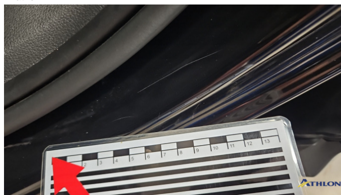
4. Türeinstieg Vorne - Links Kratzer