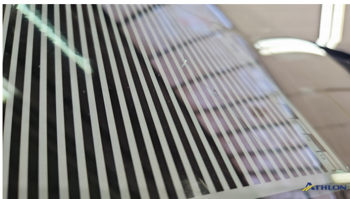
2. Windschutzscheibe Beschädigt