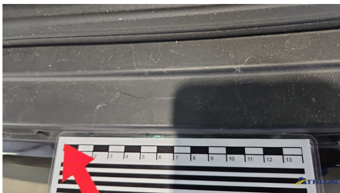
6. Stoßfänger Hinten Kratzer