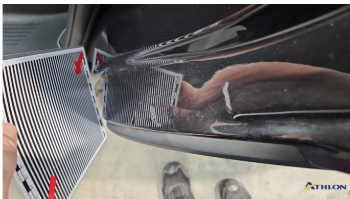
5. Türeinstieg Hinten - Links Verformt (leicht)