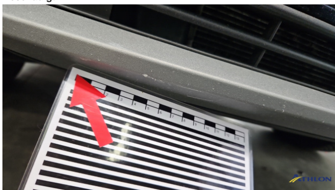
3. Stoßfänger Vorne Kratzer