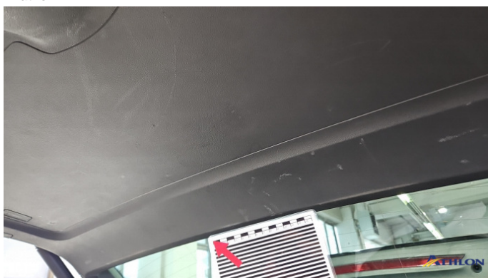
9. Kofferraum Gebrauchsspuren