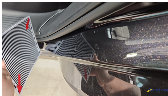
5. Türeinstieg Hinten - Links Verformt (leicht)