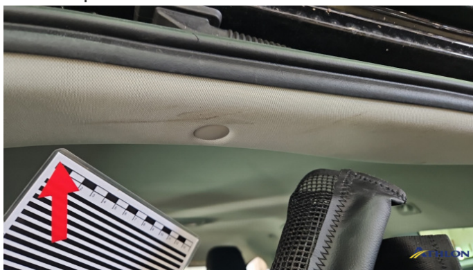
9. Kofferraum Gebrauchsspuren