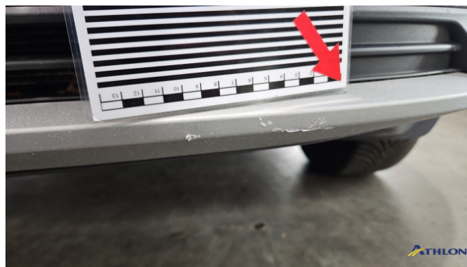
3. Stoßfänger Vorne Kratzer