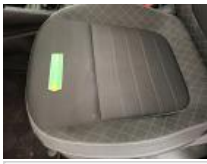
Garniture montant Mil G, Griffe(s), Réparer/rempl. (montant forfaitaire)