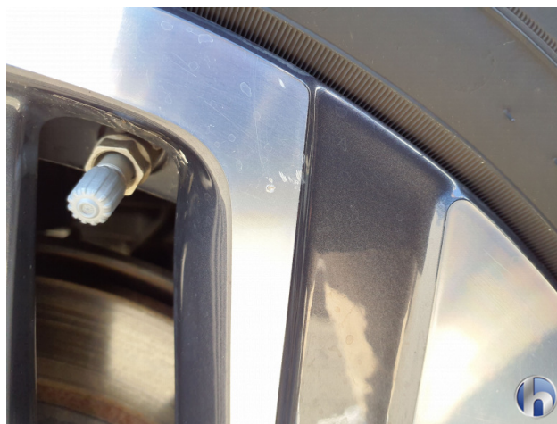
3. Felge Hinten - Rechts Kratzer - Smart Repair 120,00 € / 120,00 €