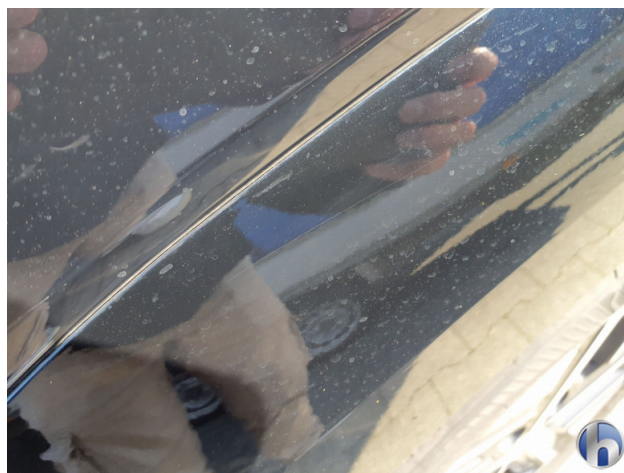
1. Kotflügel Vorne - Links