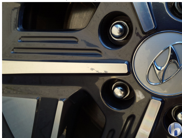
3. Felge Hinten - Rechts

Kratzer - Smart Repair 120,00 € / 120,00 €