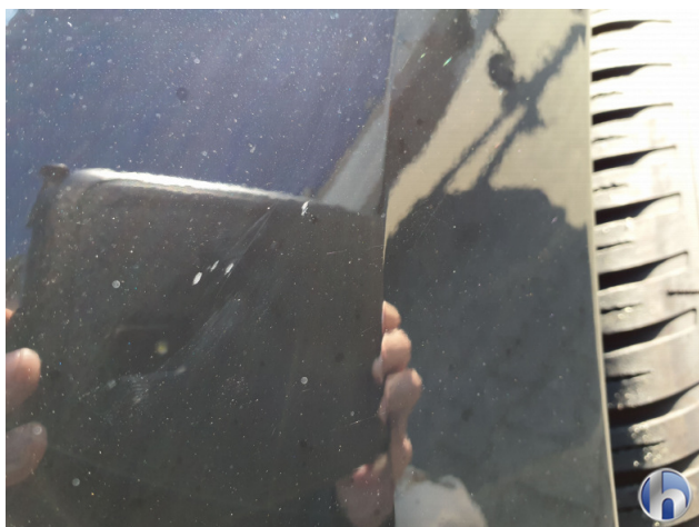
1. Kotflügel Vorne - Links