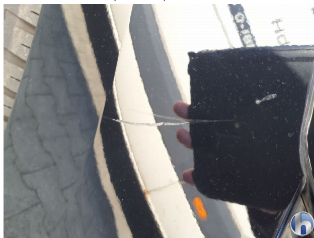
2. Kotflügel Vorne - Rechts