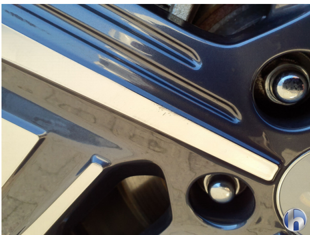
3. Felge Hinten - Rechts Kratzer - Smart Repair 120,00 € / 120,00 €