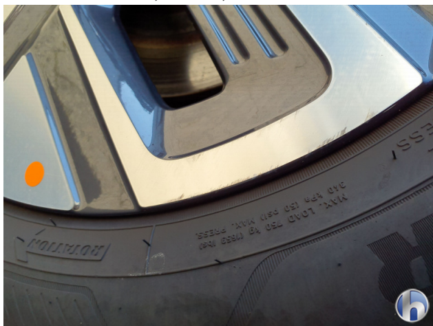
3. Felge Hinten - Rechts

Kratzer - Smart Repair 120,00 € / 120,00 €