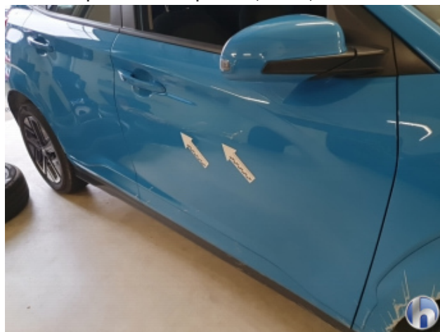
2. Tür Vorne - Rechts

Gebrauchsspuren - Ohne Reparatur 0,00 € / 0,00 €