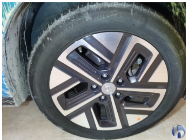
1. Felge Vorne - Rechts

Gebrauchsspuren - Ohne Reparatur 0,00 € / 0,00 €