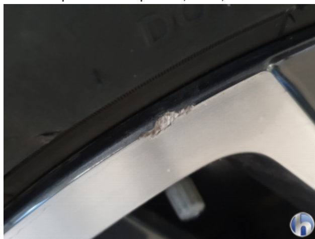
1. Felge Vorne - Rechts

Gebrauchsspuren - Ohne Reparatur 0,00 € / 0,00 €