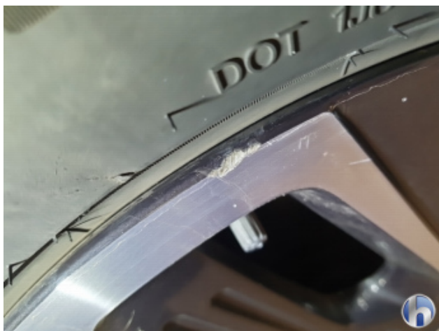
1. Felge Vorne - Rechts

Gebrauchsspuren - Ohne Reparatur 0,00 € / 0,00 €