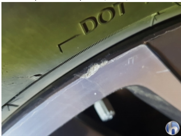
1. Felge Vorne - Rechts

Gebrauchsspuren - Ohne Reparatur 0,00 € / 0,00 €