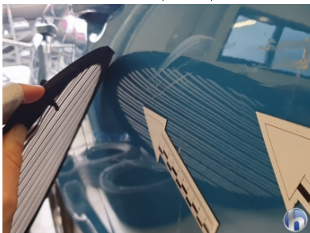
2. Tür Vorne - Rechts 2 Dellen - Sanft Instandsetzen 170,00 € / 170,00 €