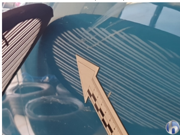
2. Tür Vorne - Rechts 2 Dellen - Sanft Instandsetzen 170,00 € / 170,00 €