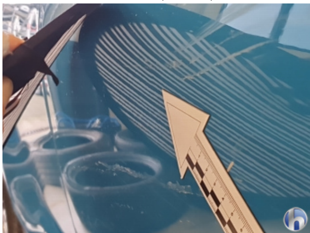
2. Tür Vorne - Rechts 2 Dellen - Sanft Instandsetzen 170,00 € / 170,00 €