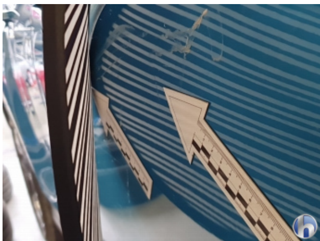
2. Tür Vorne - Rechts 2 Dellen - Sanft Instandsetzen 170,00 € / 170,00 €