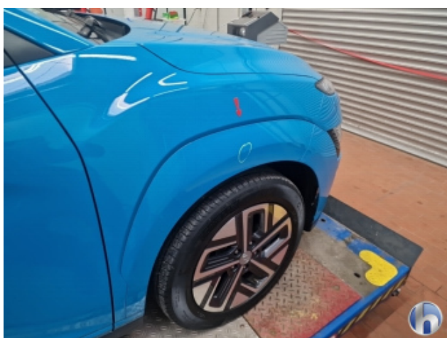
1. Kotflügel Vorne - Rechts

Steinschlag - Smart Repair 120,00 € / 120,00 €