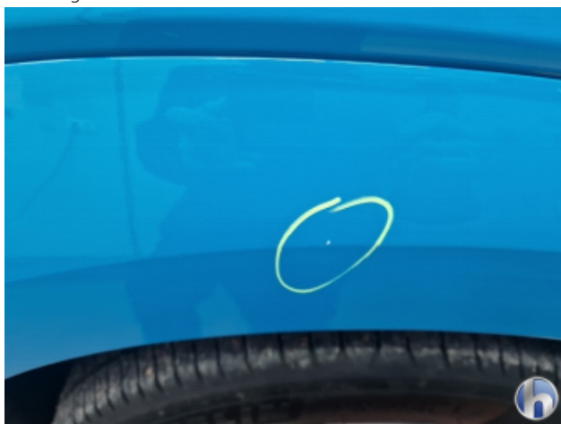
1. Kotflügel Vorne - Rechts

Steinschlag - Smart Repair 120,00 € / 120,00 €