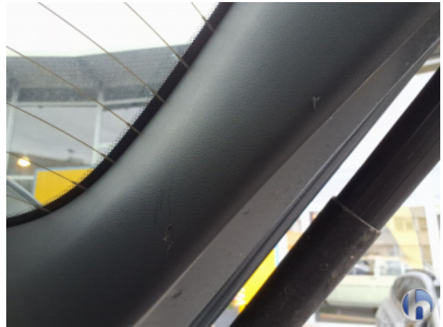
7. Verkleidung Gebrauchsspuren - Ohne Reparatur