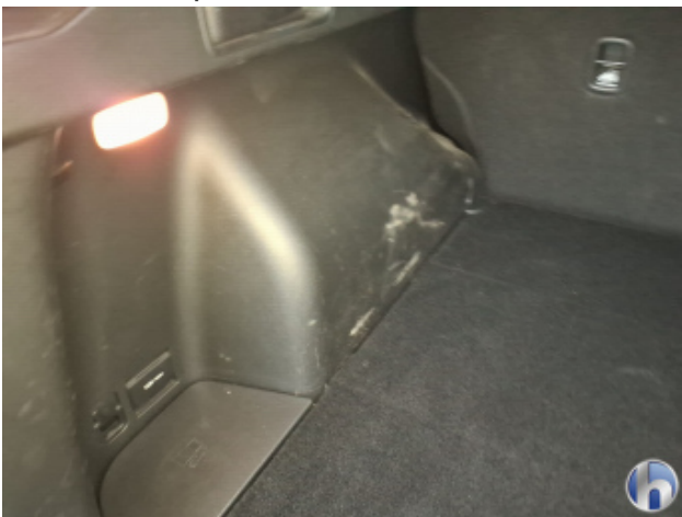
8. Innenraum Beschädigt - Erneuern