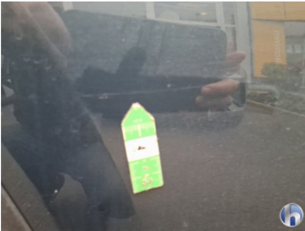
6. Tür Hinten - Rechts Kratzer - Smart Repair