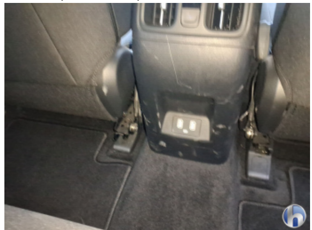
9. Mittelkonsole Innenraum vorne mitte Beschädigt - Erneuern