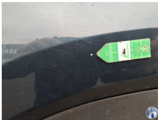
1. Tür Hinten - Links Kratzer - Smart Repair