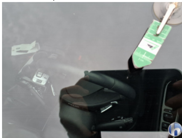
5. Windschutzscheibe Steinschlag - Smart Repair