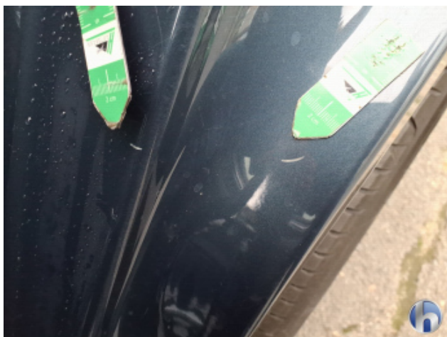
2. Schweller - Links Kratzer - Smart Repair