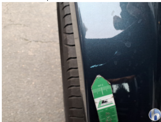
3. Schweller - Rechts Kratzer - Smart Repair