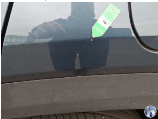
4. Seitenwand - Hinten - Links Kratzer - Smart Repair