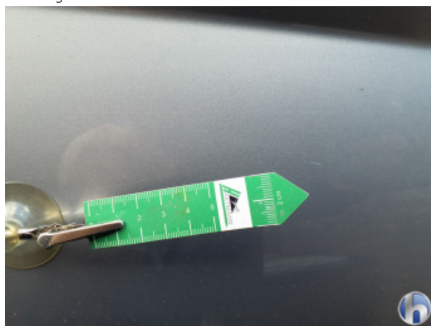
1. Seitenwand - Hinten - Rechts Gebrauchsspuren - Ohne Reparatur