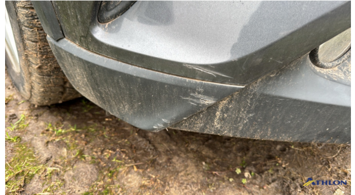
6. spoiler anteriore Graffio/Rigature