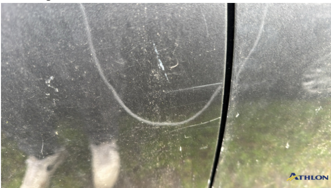
7. porta posteriore - destra Graffio/Rigature