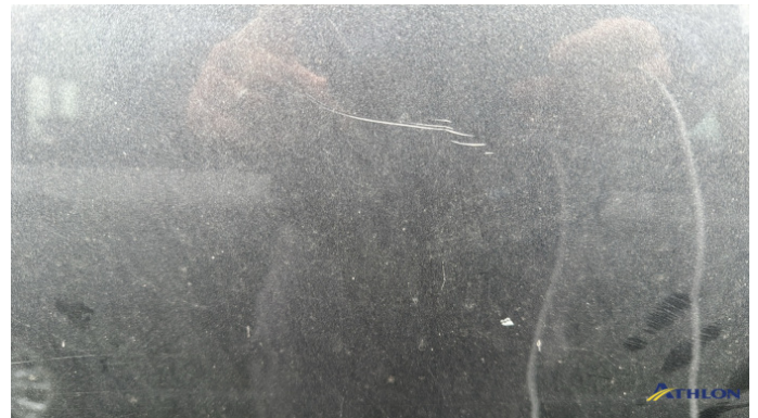
7. porta posteriore - destra Graffio/Rigature