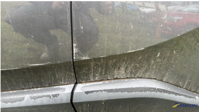
4. porta posteriore - sinistra Graffio/Rigature