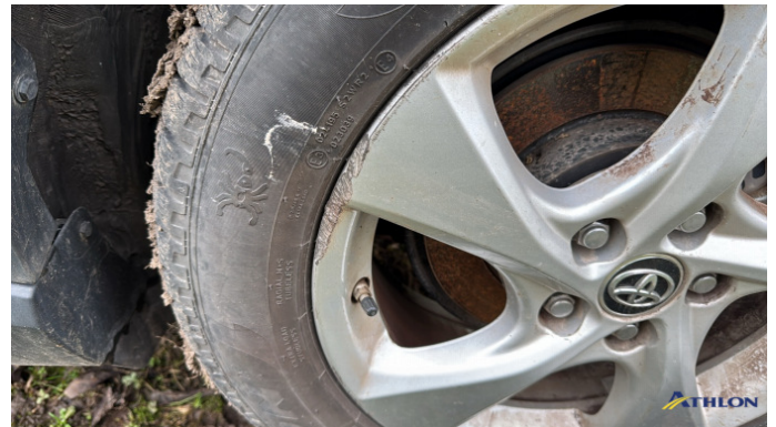
5. cerchione posteriore - sinistro Graffio/Rigature