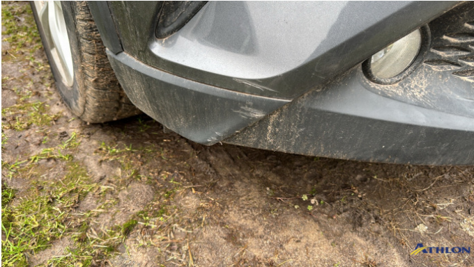
6. spoiler anteriore Graffio/Rigature