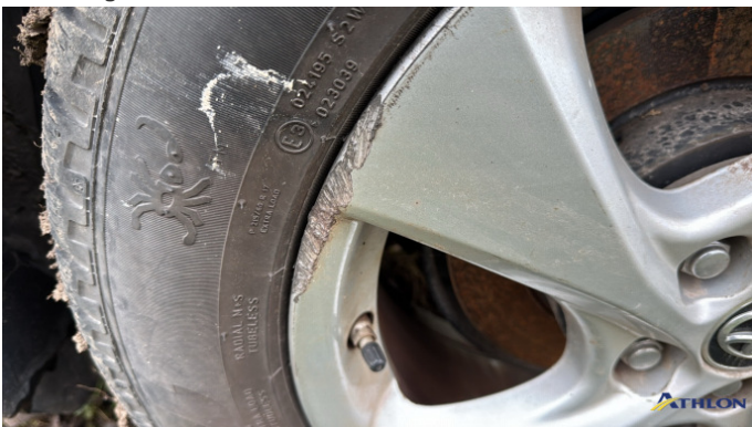
5. cerchione posteriore - sinistro Graffio/Rigature