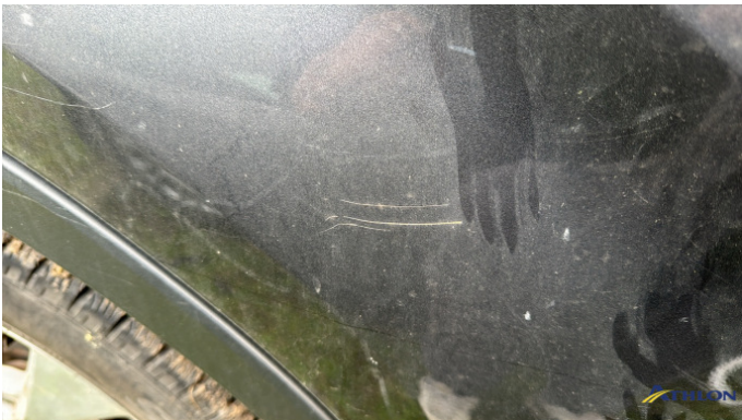
7. porta posteriore - destra Graffio/Rigature