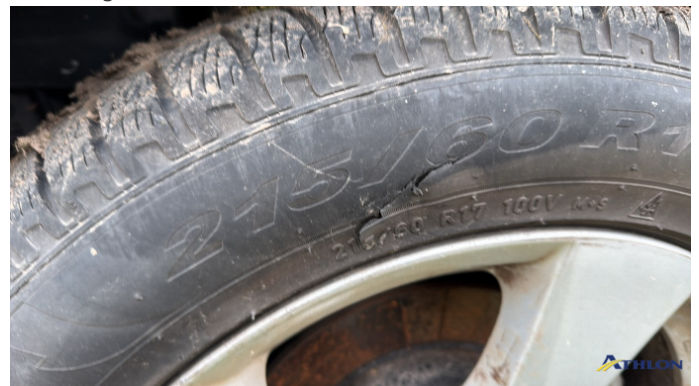
5. cerchione posteriore - sinistro Graffio/Rigature