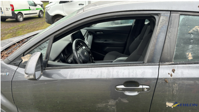
2. finestra laterale - anteriore - sinistra Mancante