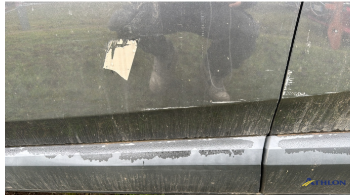
3. porta anteriore - sinistra Graffio/Rigature