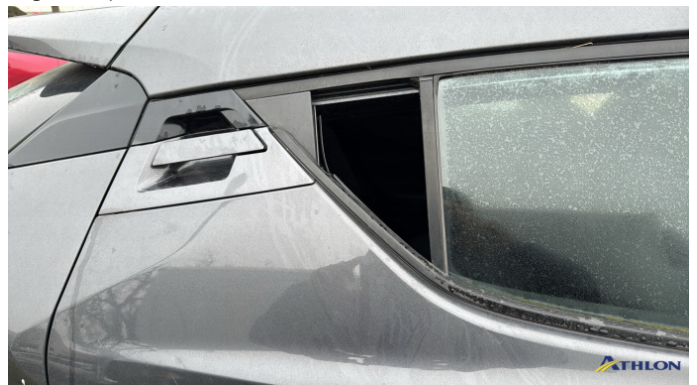
1. finestra laterale - posteriore - destra Mancante