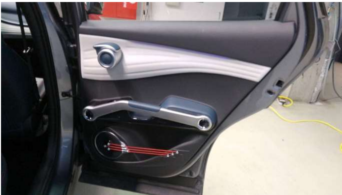
7. Türverkleidung Hinten - Rechts Gebrauchsspuren - Ohne Reparatur 0,00 € / 0,00 €