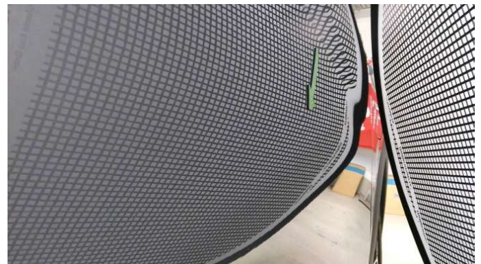
5. Tür Vorne - Rechts

1 Delle - Instandsetzen und Lackieren 75,00 € / 75,00 €