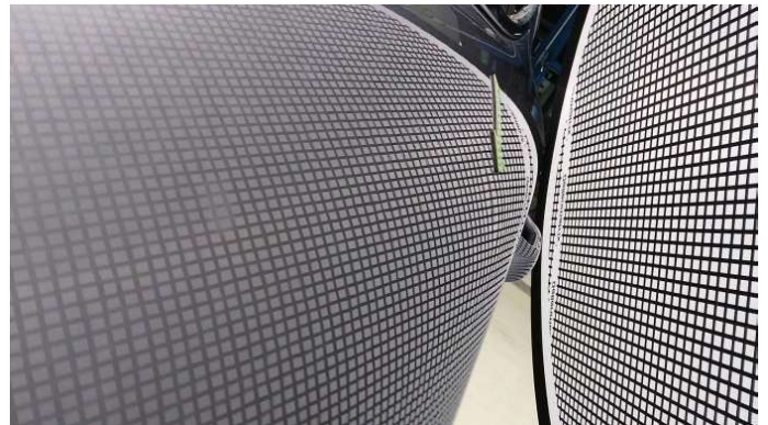
2. Tür Hinten - Links

3 Dellen - Instandsetzen und Lackieren 75,00 € / 75,00 €