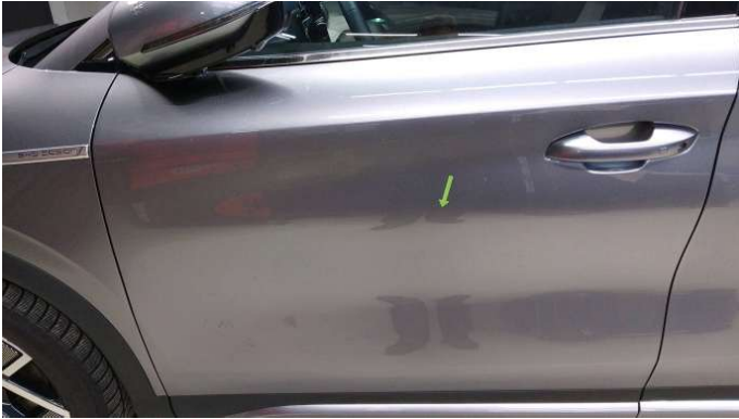
1. Tür Vorne - Links

1 Delle - Instandsetzen und Lackieren 0,00 € / 0,00 €