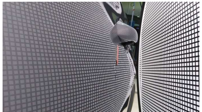
2. Tür Hinten - Links

3 Dellen - Instandsetzen und Lackieren 75,00 € / 75,00 €