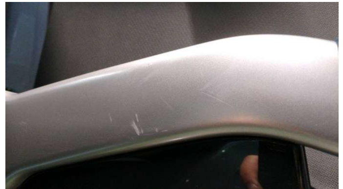
7. Türverkleidung Hinten - Rechts Gebrauchsspuren - Ohne Reparatur 0,00 € / 0,00 €