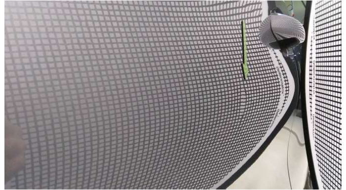
1. Tür Vorne - Links

1 Delle - Instandsetzen und Lackieren 0,00 € / 0,00 €