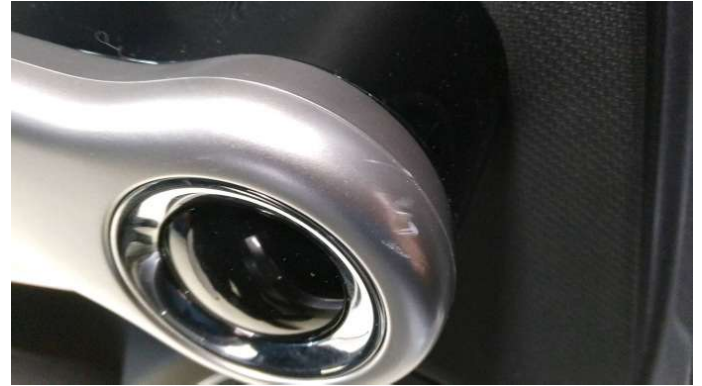
6. Türverkleidung Hinten - Links Kratzer - Smart Repair 200,00 € / 200,00 €