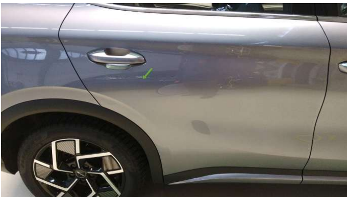
4. Tür Hinten - Rechts

1 Delle - Instandsetzen und Lackieren 75,00 € / 75,00 €