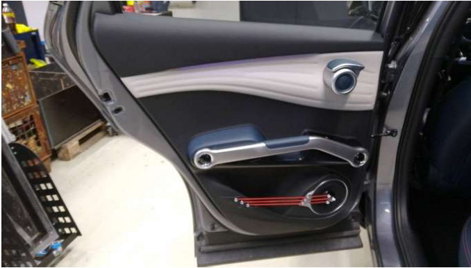
6. Türverkleidung Hinten - Links Kratzer - Smart Repair 200,00 € / 200,00 €