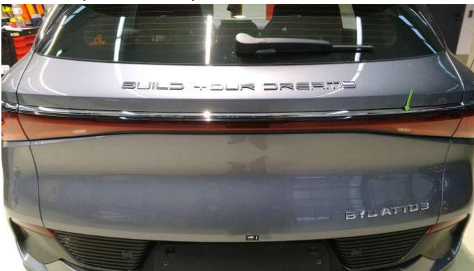
11. Mittlere Rückleuchte Riss - Erneuern 503,85 € / 503,85 €