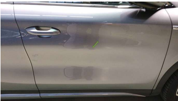
5. Tür Vorne - Rechts

1 Delle - Instandsetzen und Lackieren 75,00 € / 75,00 €