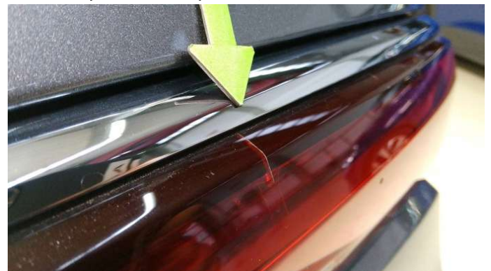
11. Mittlere Rückleuchte Riss - Erneuern 503,85 € / 503,85 €