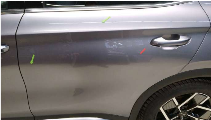
2. Tür Hinten - Links

1 Delle - Instandsetzen und Lackieren 0,00 € / 0,00 €