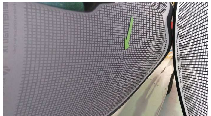
4. Tür Hinten - Rechts

1 Delle - Instandsetzen und Lackieren 75,00 € / 75,00 €