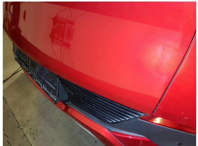
16. Schriftzug Modell hinten seitlich Fehlt - Erneuern 35,73 € / 35,73 €