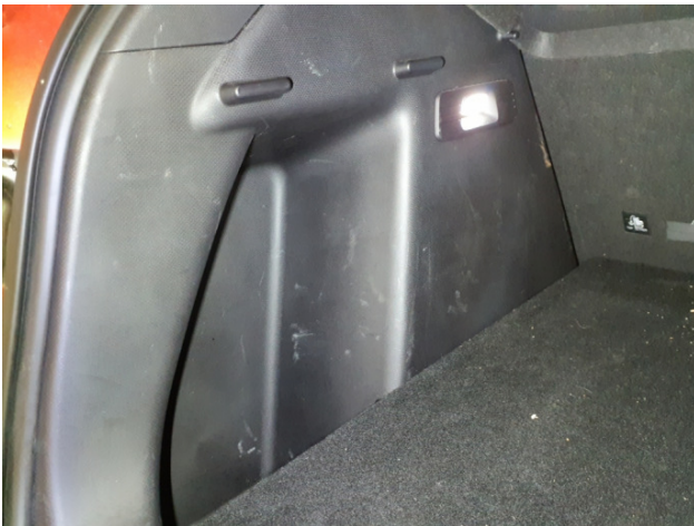
14. Verkleidung C-Säule unten bis Laderaum Links Gebrauchsspuren - Ohne Reparatur 0,00 € / 0,00 €