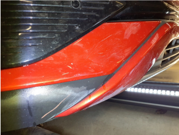
1. Stoßfänger Vorne Kratzer - Instandsetzen und Lackieren 332,50 € / 332,50 €