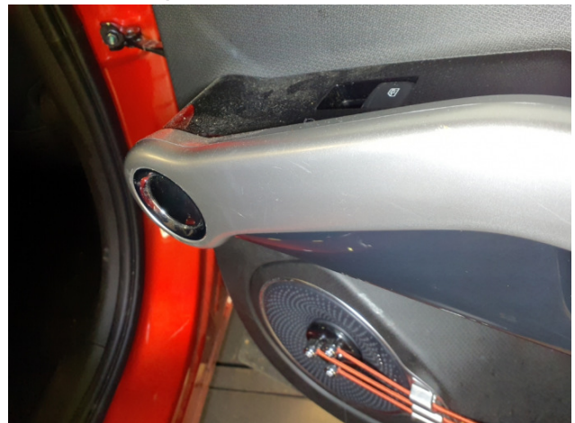
7. Türverkleidung Hinten - Links Gebrauchsspuren - Ohne Reparatur 0,00 € / 0,00 €