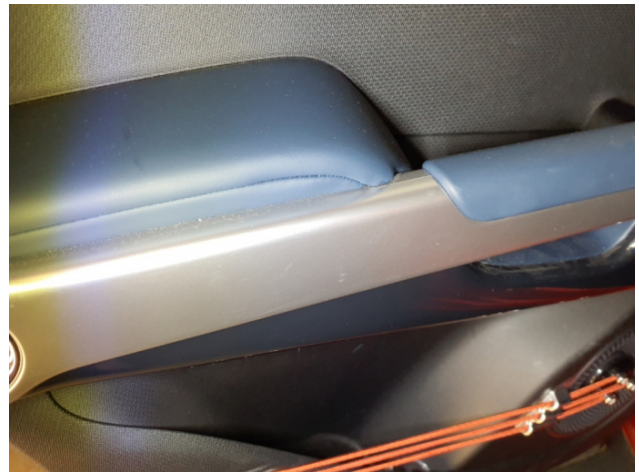
6. Türverkleidung Hinten - Links Kratzer - Smart Repair 200,00 € / 200,00 €