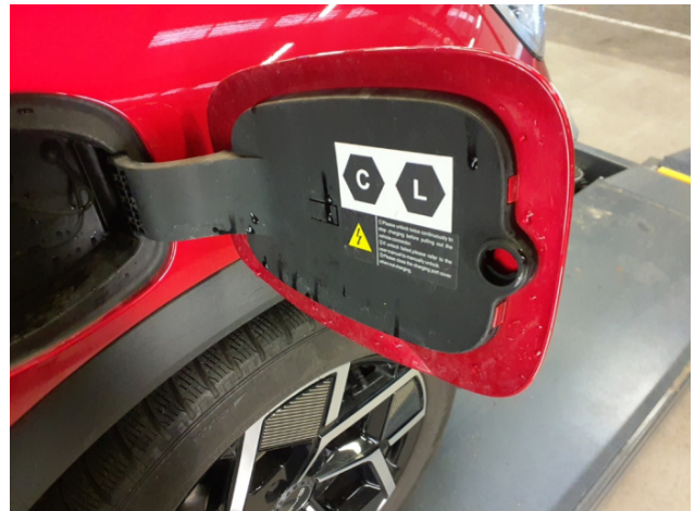
2. Tankklappe Bruch - Erneuern 173,11 € / 173,11 €