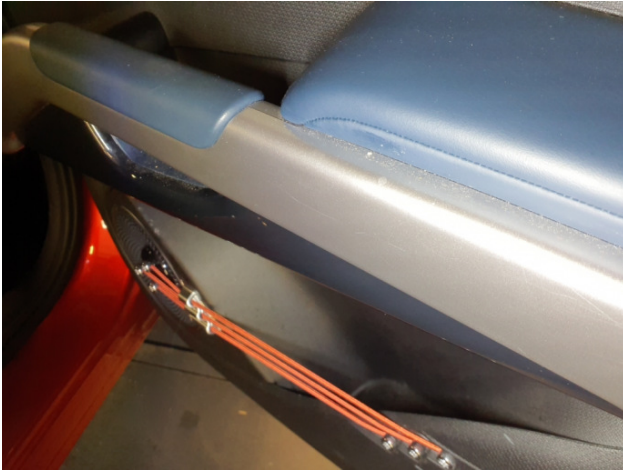
7. Türverkleidung Hinten - Links Gebrauchsspuren - Ohne Reparatur 0,00 € / 0,00 €