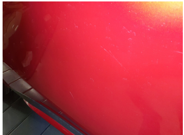
3. Tür Hinten - Rechts Kratzer - Aufbereiten / Polieren 28,50 € / 28,50 €