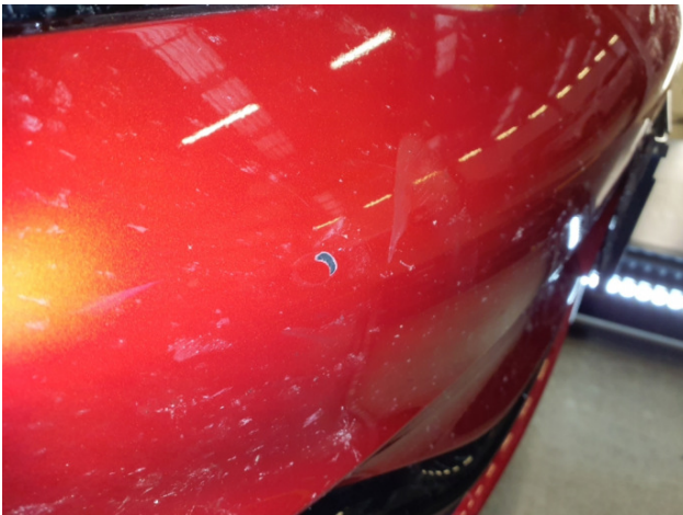
1. Stoßfänger Vorne Kratzer - Instandsetzen und Lackieren 332,50 € / 332,50 €