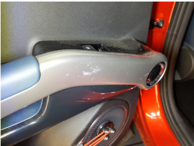
6. Türverkleidung Hinten - Links Kratzer - Smart Repair 200,00 € / 200,00 €