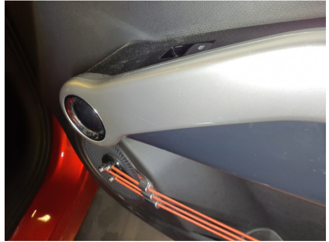
8. Türverkleidung Vorne - Rechts Gebrauchsspuren - Ohne Reparatur 0,00 € / 0,00 €