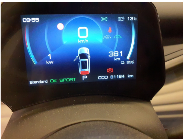
9. Wartung Fällig - Erneuern 0,00 € / 0,00 €