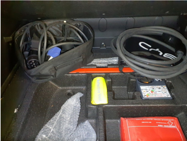
12. Tirfit Füllmittel Fehlt - Erneuern 75,00 € / 75,00 €