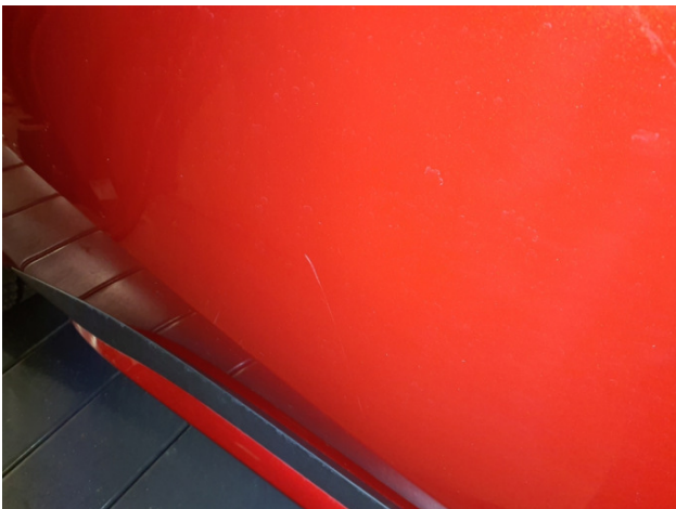
3. Tür Hinten - Rechts Kratzer - Aufbereiten / Polieren 28,50 € / 28,50 €