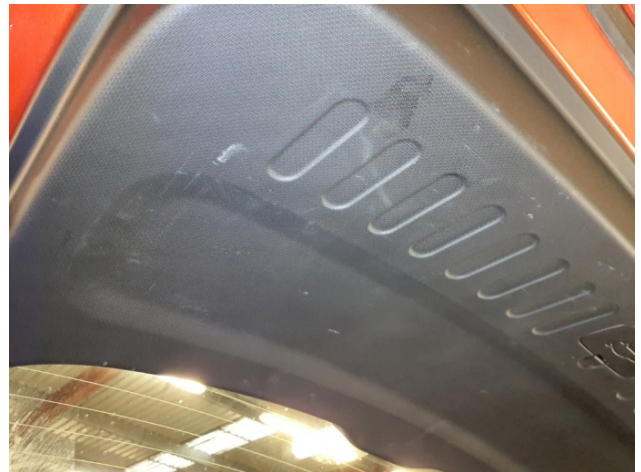
15. Verkleidung Heckklappe Gebrauchsspuren - Ohne Reparatur 0,00 € / 0,00 €