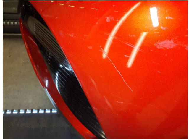
1. Stoßfänger Vorne Kratzer - Instandsetzen und Lackieren 332,50 € / 332,50 €