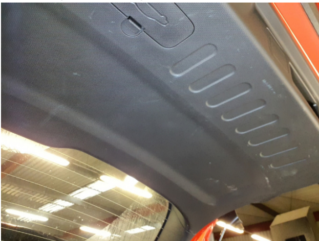
15. Verkleidung Heckklappe Gebrauchsspuren - Ohne Reparatur 0,00 € / 0,00 €