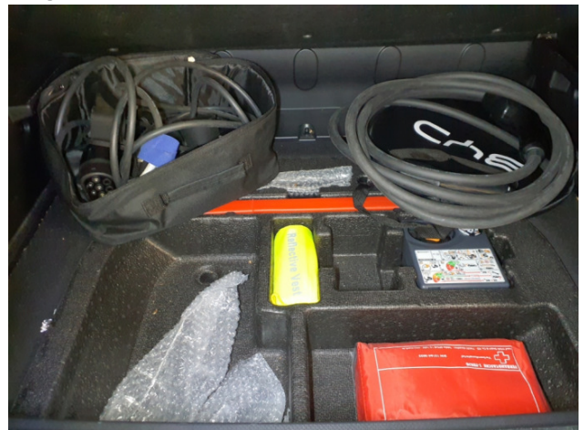
11. VTL Kabel Fehlt - Erneuern 0,00 € / 0,00 €