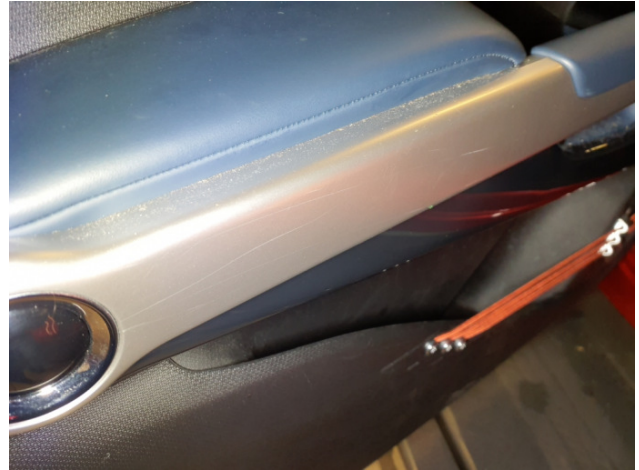
5. Türverkleidung Vorne - Links Gebrauchsspuren - Ohne Reparatur 0,00 € / 0,00 €