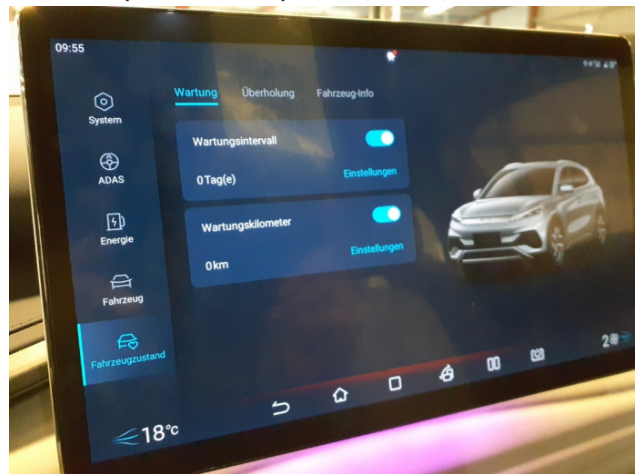
9. Wartung Fällig - Erneuern 0,00 € / 0,00 €