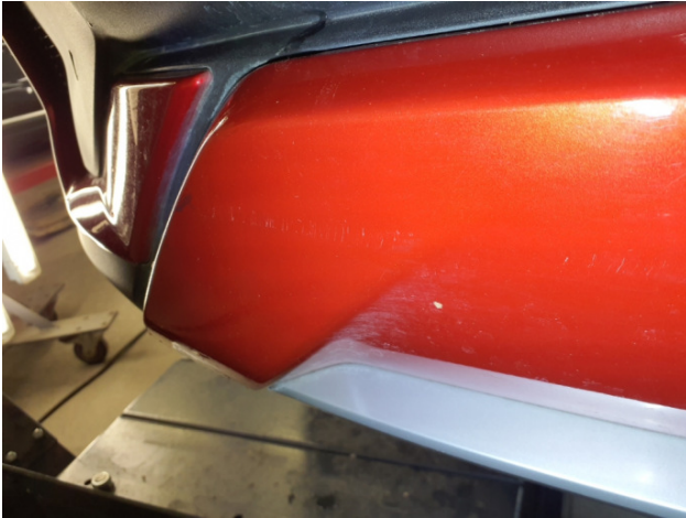
4. Stoßfänger Hinten Kratzer - Aufbereiten / Polieren 28,50 € / 28,50 €