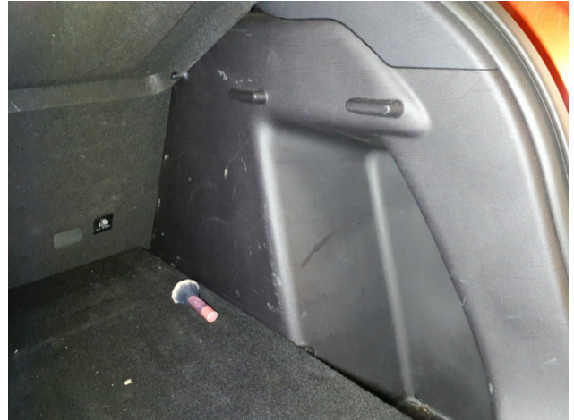
13. Verkleidung C-Säule unten bis Laderaum Rechts Gebrauchsspuren - Ohne Reparatur 0,00 € / 0,00 €