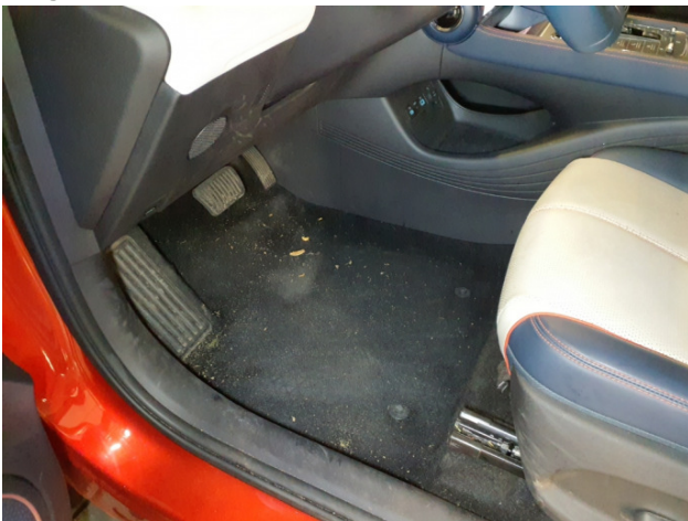
10. Fußmattensatz Fehlt - Erneuern 0,00 € / 0,00 €