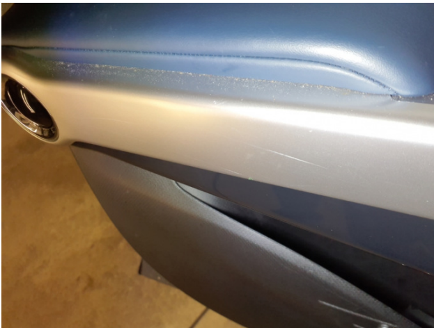
5. Türverkleidung Vorne - Links Gebrauchsspuren - Ohne Reparatur 0,00 € / 0,00 €