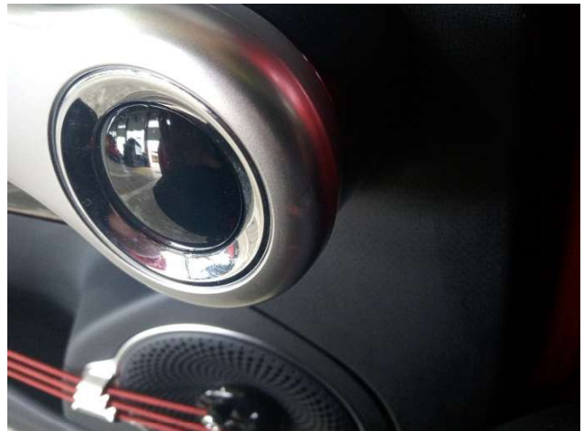
2. Türverkleidung Hinten - Links Gebrauchsspuren - Ohne Reparatur 0,00 € / 0,00 €