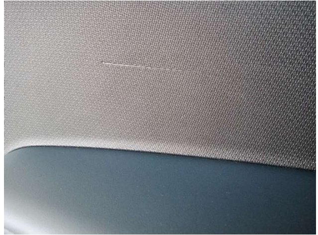
1. Türverkleidung Vorne - Links Gebrauchsspuren - Ohne Reparatur 0,00 € / 0,00 €