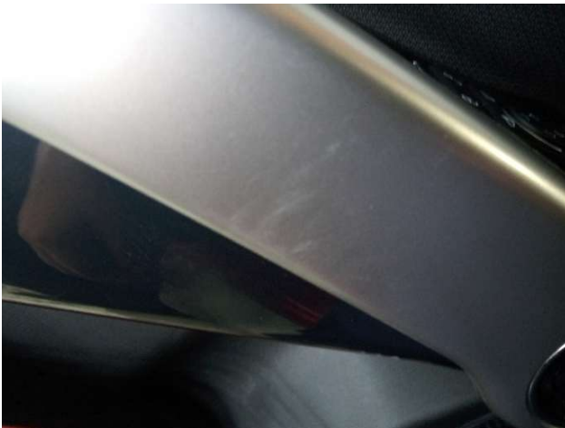
1. Türverkleidung Vorne - Links Gebrauchsspuren - Ohne Reparatur 0,00 € / 0,00 €