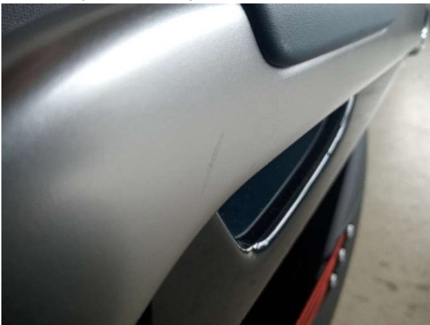
3. Türverkleidung Hinten - Rechts Gebrauchsspuren - Ohne Reparatur 0,00 € / 0,00 €