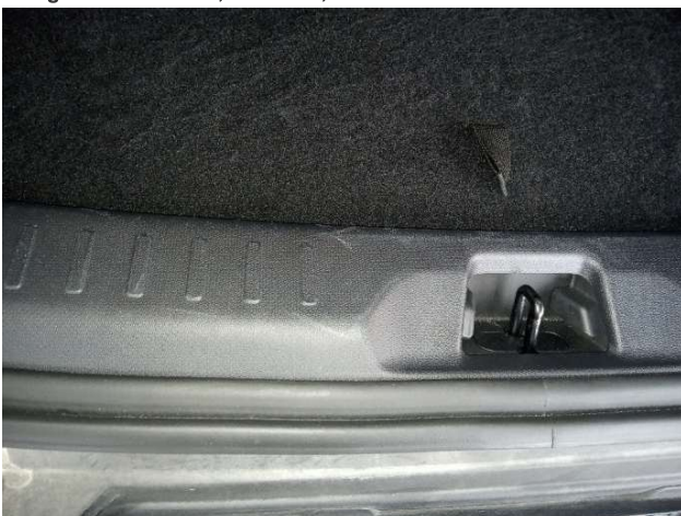
8. Verkleidung Schlossträger Kofferraum Gebrauchsspuren - Ohne Reparatur 0,00 € / 0,00 €