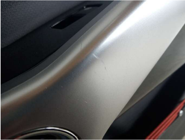
4. Türverkleidung Vorne - Rechts Gebrauchsspuren - Ohne Reparatur 0,00 € / 0,00 €