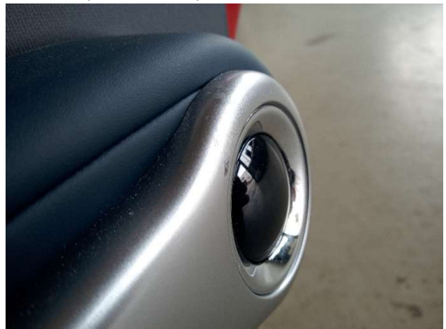
3. Türverkleidung Hinten - Rechts Gebrauchsspuren - Ohne Reparatur 0,00 € / 0,00 €