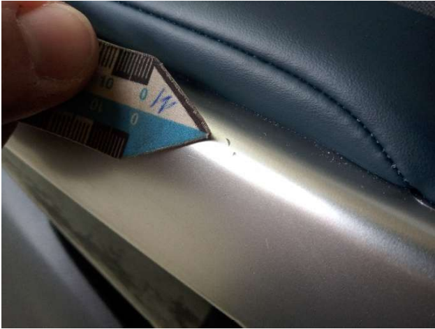
1. Türverkleidung Vorne - Links Gebrauchsspuren - Ohne Reparatur 0,00 € / 0,00 €