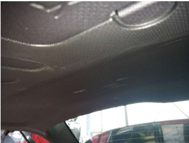
11. Verkleidung Heckklappe Gebrauchsspuren - Ohne Reparatur 0,00 € / 0,00 €