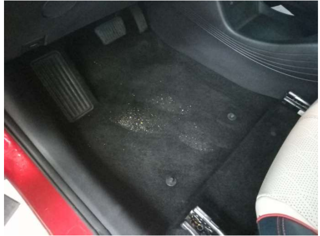
5. Fussmattensatz Fehlt - Erneuern 0,00 € / 0,00 €