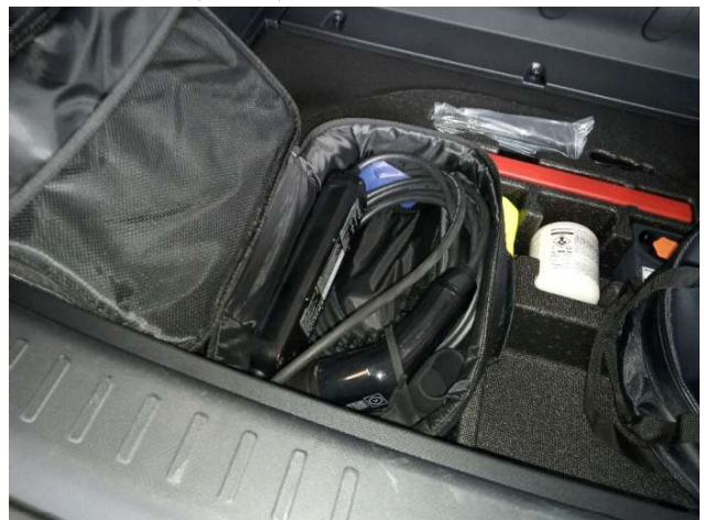
7. VTL Kabel Fehlt - Erneuern 0,00 € / 0,00 €