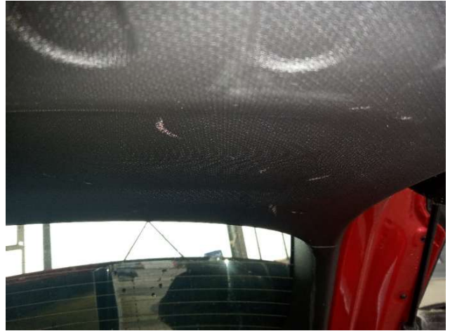
11. Verkleidung Heckklappe Gebrauchsspuren - Ohne Reparatur 0,00 € / 0,00 €