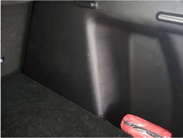
10. Verkleidung C-Säule unten bis Laderaum rechts Gebrauchsspuren - Ohne Reparatur 0,00 € / 0,00 €