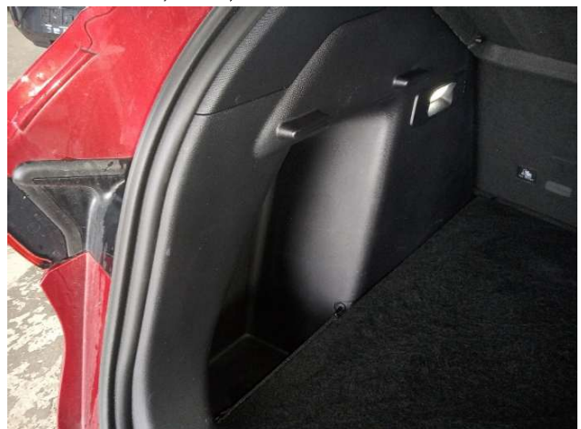
9. Verkleidung C-Säule unten bis Laderaum links Gebrauchsspuren - Ohne Reparatur 0,00 € / 0,00 €