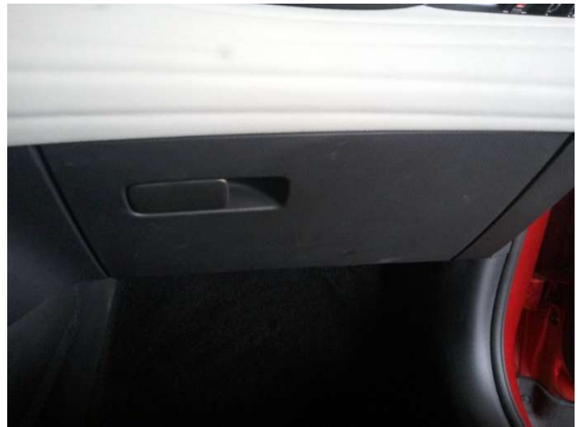
12. Handschuhfach Gebrauchsspuren - Ohne Reparatur 0,00 € / 0,00 €