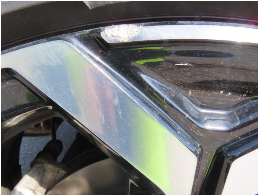
Bild 13 Alufelge hinten rechts Verschrammt - Erneuern