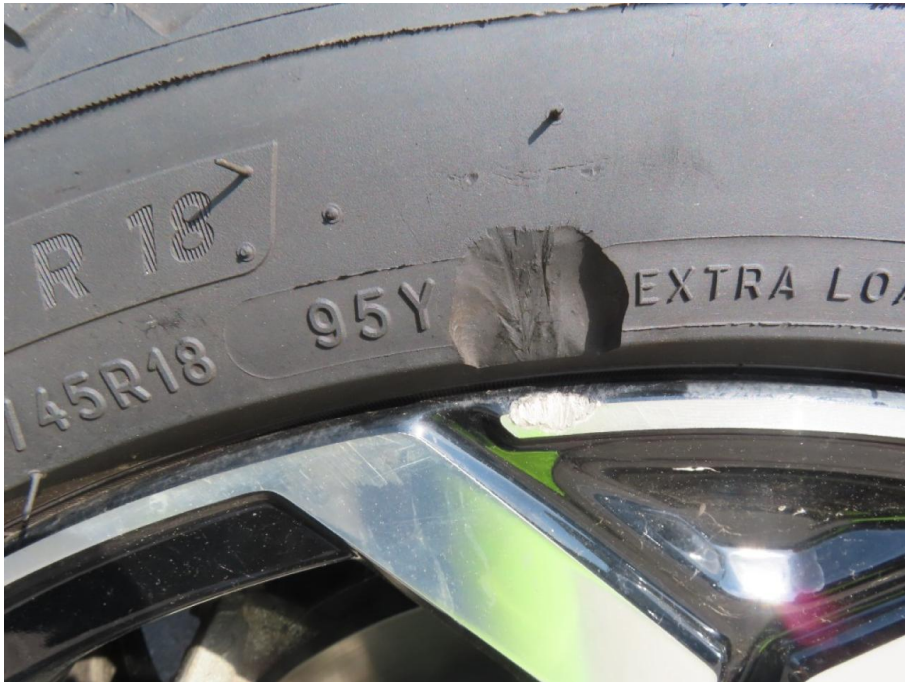
Bild 11 Reifen hinten rechts Beschädigt - Erneuern