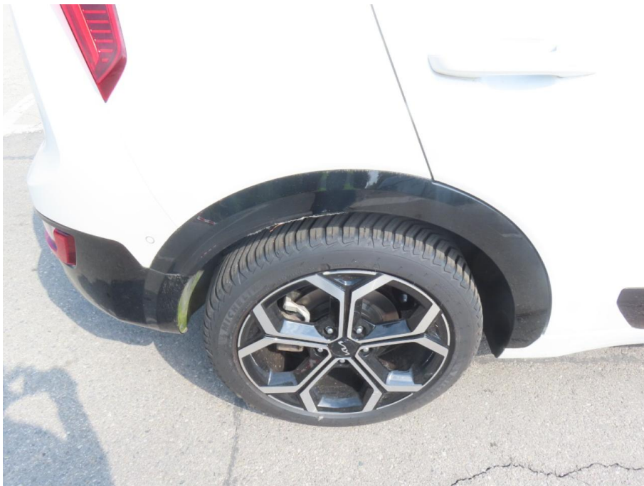
Bild 12 Reifen hinten rechts Beschädigt - Erneuern