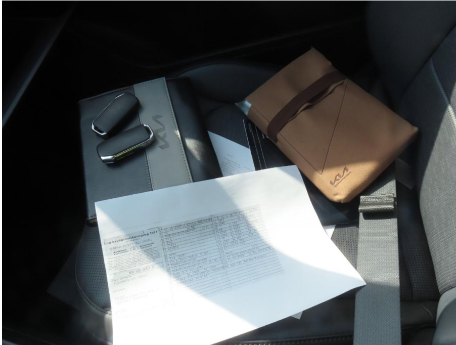
Bild 5 Schlüssel, Borddokumente