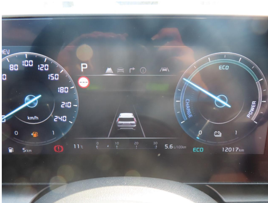
Bild 3 Tacho bei lfd. Motor