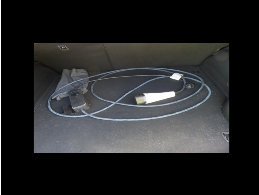
Bild 7 Bordwerkzeug/Zubehör