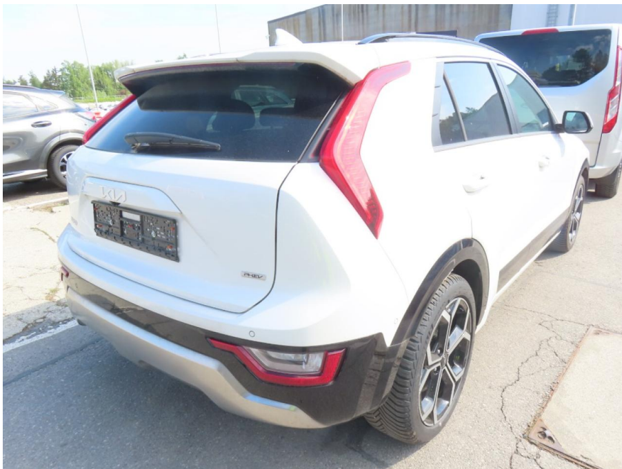
Bild 2 Diagonale hinten rechts