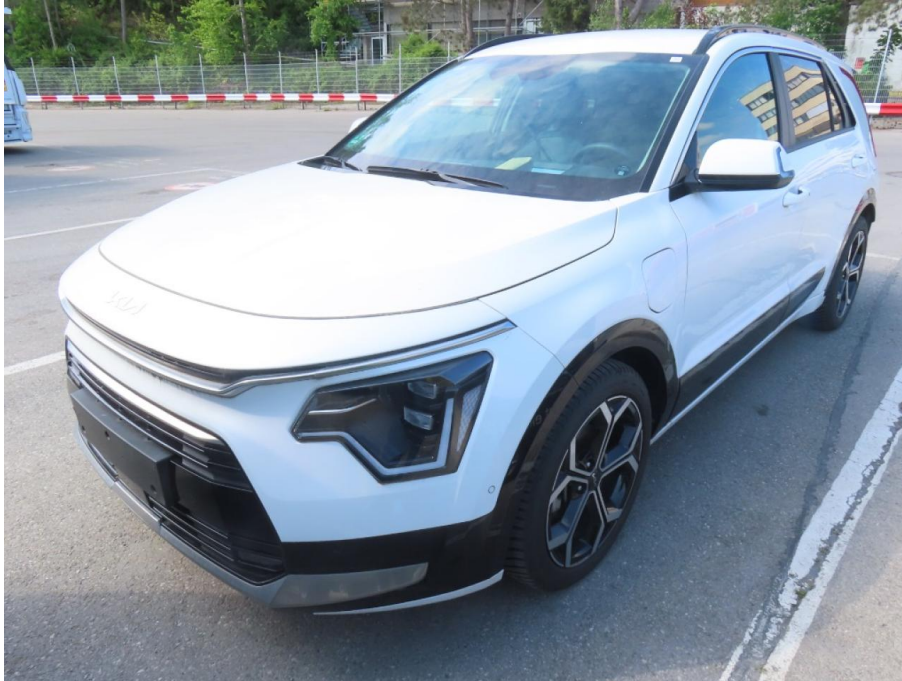
Bild 1 Übersicht vorn links