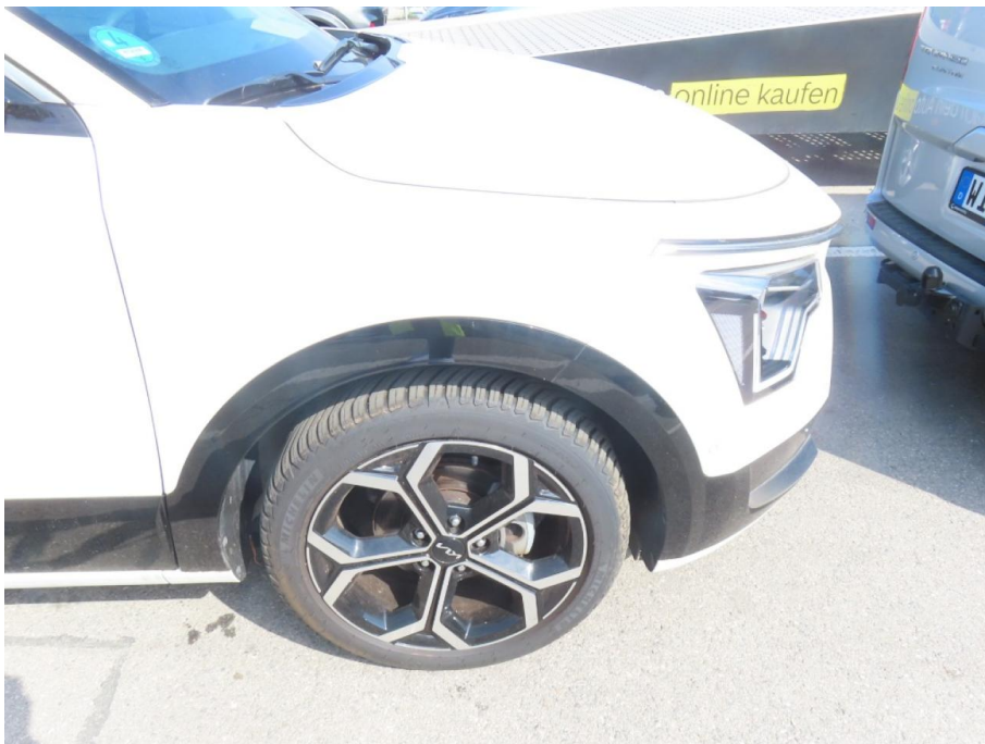
Bild 16 Alufelge vorne rechts Verschrammt