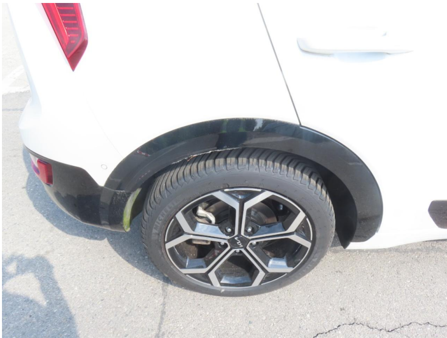
Bild 14 Alufelge hinten rechts Verschrammt - Erneuern