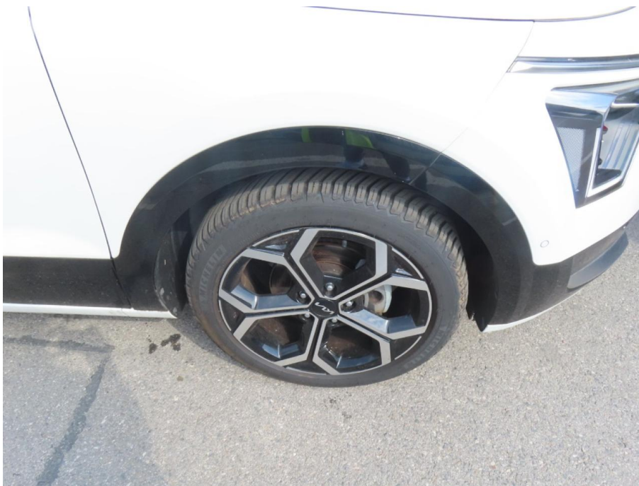
Bild 8 Reifen