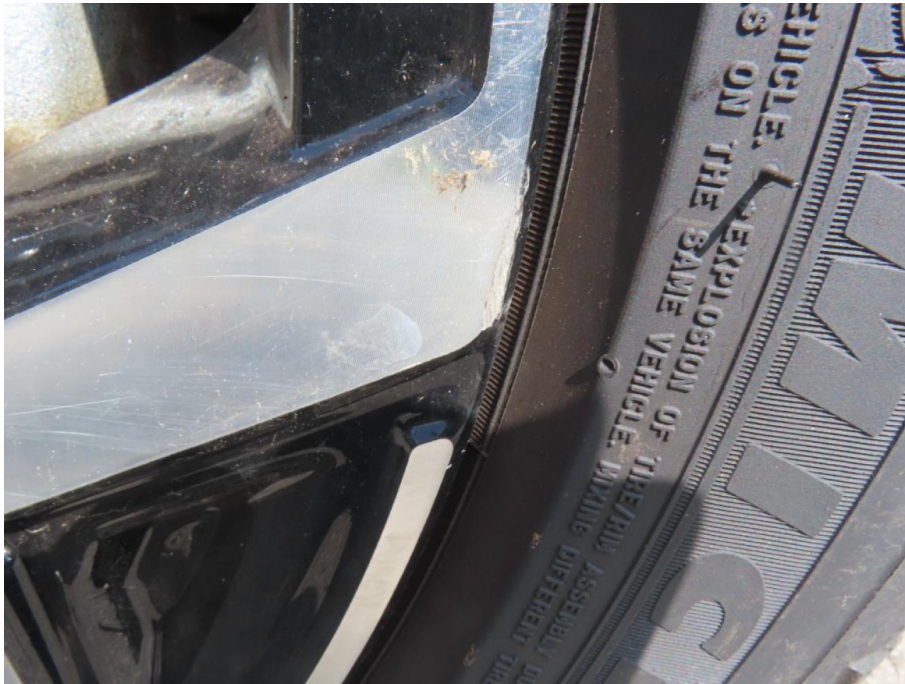
Bild 15 Alufelge vorne rechts Verschrammt