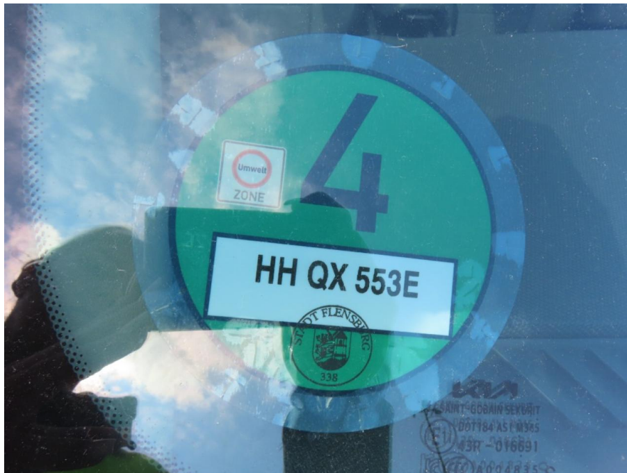
Bild 9 Umweltplakette