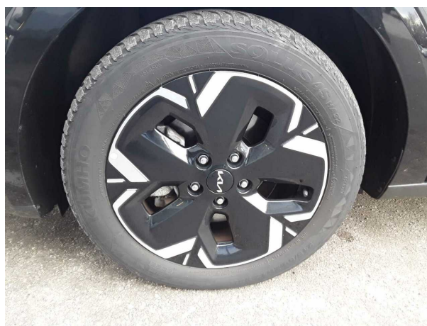
Abbildung 6: Montierte Bereifung