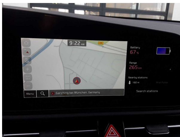
Abbildung 12: Instrumententafel