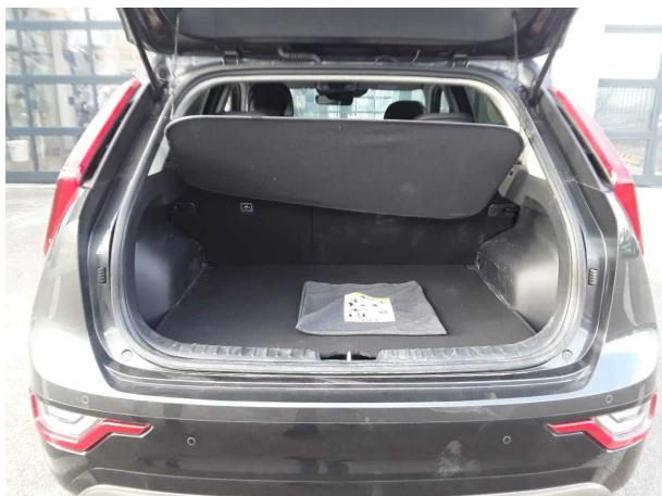
Beschädigung #1: Interieur: Hutablage - gebrochen / gerissen - erneuern