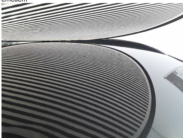
Beschädigung #2: Fahrzeugdach: Dach - Delle(n) - Smart Repair