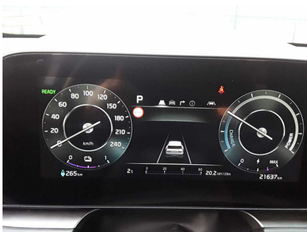
Abbildung 9: Kombiinstrument