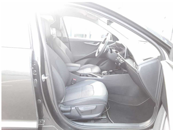
Abbildung 7: Innenraum vorne