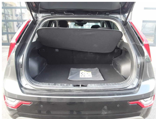
Abbildung 8: Laderaum