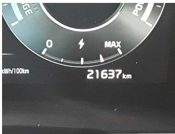
Abbildung 10: Kombiinstrument