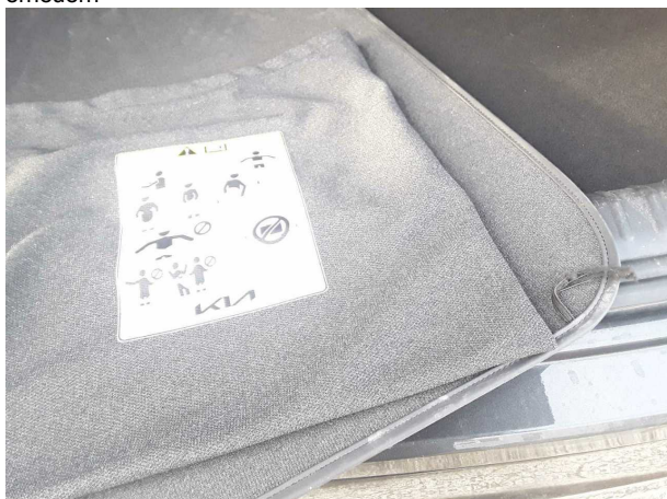
Beschädigung #1: Interieur: Hutablage - gebrochen / gerissen - erneuern