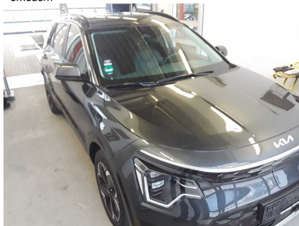
Beschädigung #2: Fahrzeugdach: Dach - Delle(n) - Smart Repair