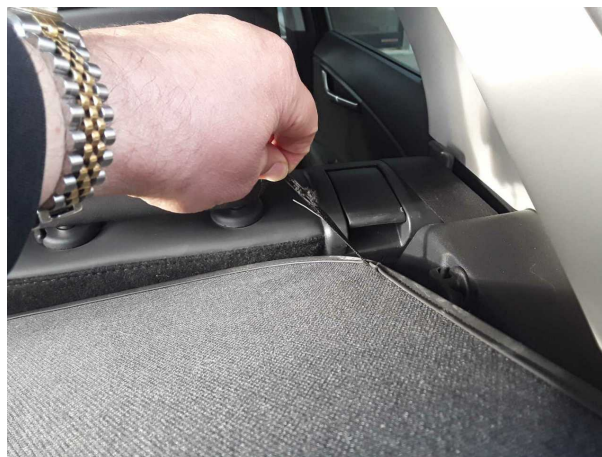
Beschädigung #1: Interieur: Hutablage - gebrochen / gerissen - erneuern