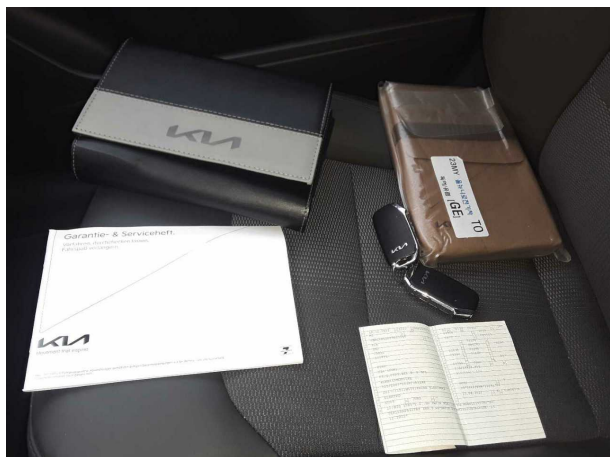
Abbildung 13: Dokumente