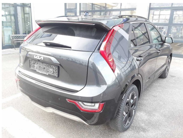
Abbildung 5: Schräg hinten