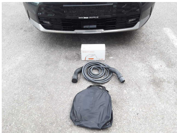
Abbildung 15: Sonstiges