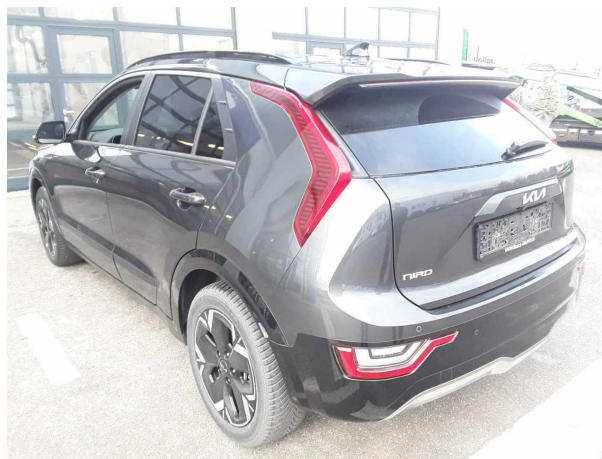
Abbildung 4: Schräg hinten