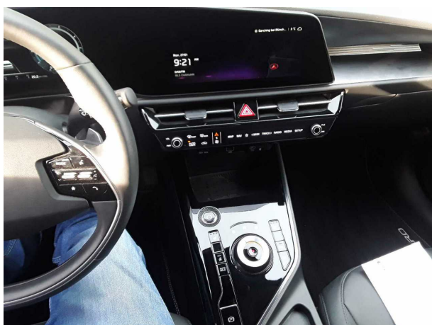
Abbildung 11: Instrumententafel