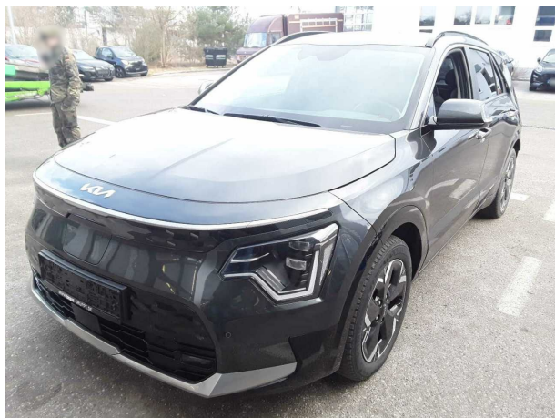
Abbildung 3: Schräg vorne