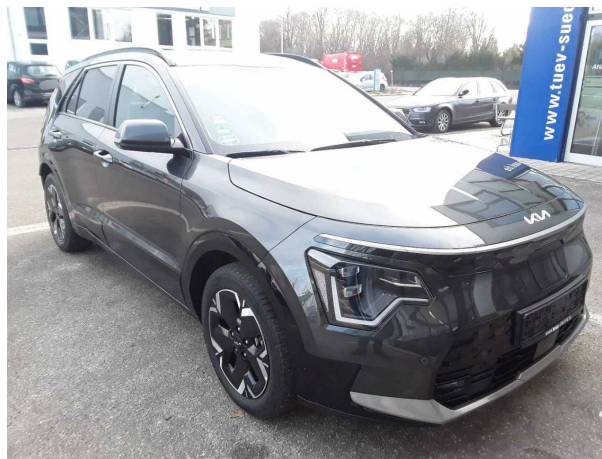
Abbildung 2: Schräg vorne