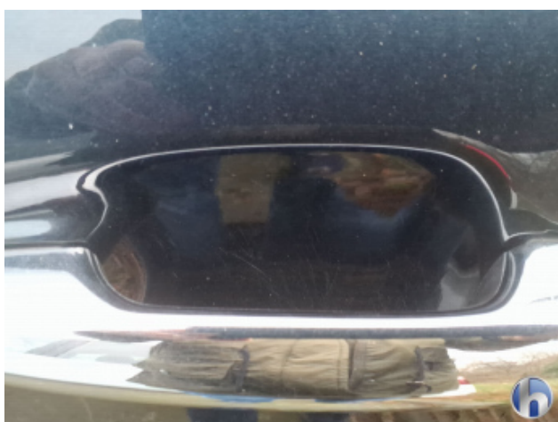
2. Tür Hinten - Links