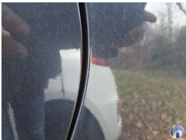
4. Seitenwand - Hinten - Links Gebrauchsspuren - Ohne Reparatur