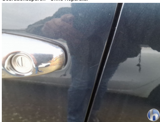
3. Tür Vorne - Links