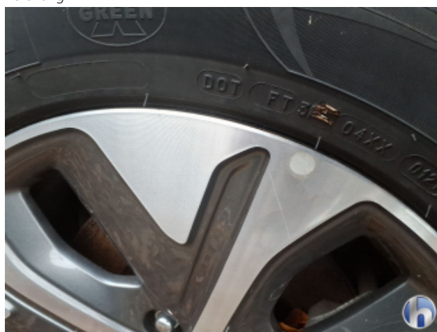
1. Felge Vorne - Rechts