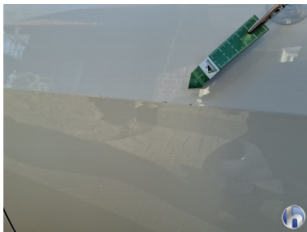
2. Tür Hinten - Links Kratzer - Smart Repair