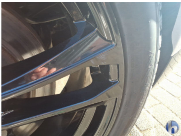
1. Felge Hinten - Links Kratzer - Smart Repair