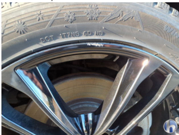
3. Felge Vorne - Rechts Kratzer - Smart Repair