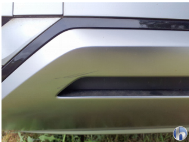
1. Stoßfänger Hinten Kratzer - Smart Repair