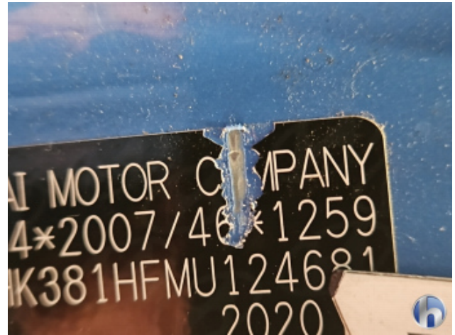
1. Türeinstieg Vorne - Links Beschädigt - Smart Repair