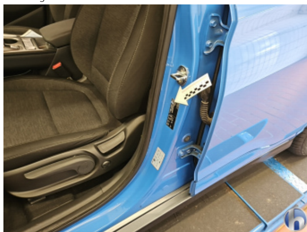
1. Türeinstieg Vorne - Links Beschädigt - Smart Repair