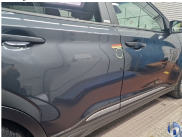
1. Tür Hinten - Rechts

Delle - Sanft Instandsetzen 85,00 € / 85,00 €