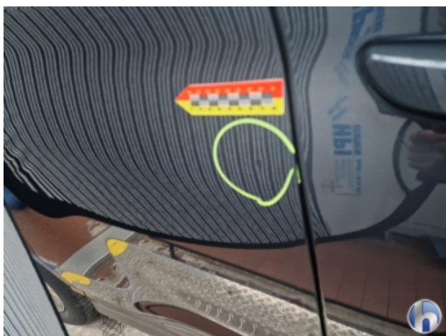
1. Tür Hinten - Rechts

Delle - Sanft Instandsetzen 85,00 € / 85,00 €