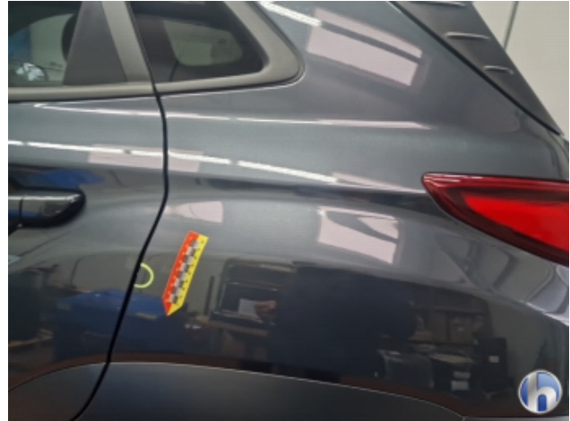
3. Seitenwand - Hinten - Links

Delle - Sanft Instandsetzen 85,00 € / 85,00 €