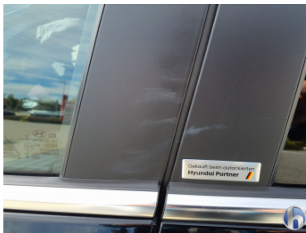
3. B-Säule Mitte - Links Lackabplatzer - Erneuern