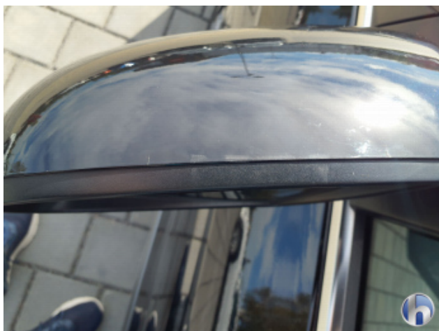
2. Außenspiegel - Links Gebrauchsspuren - Ohne Reparatur