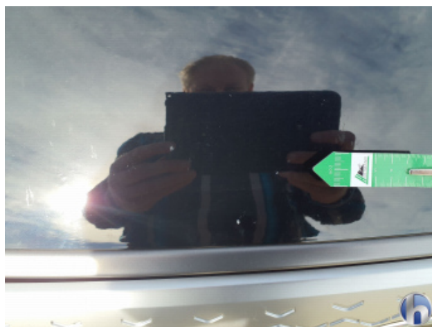
1. Motorhaube Steinschlag - Ohne Reparatur