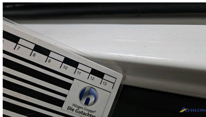
2. Türeinstieg Vorne - Links Kratzer