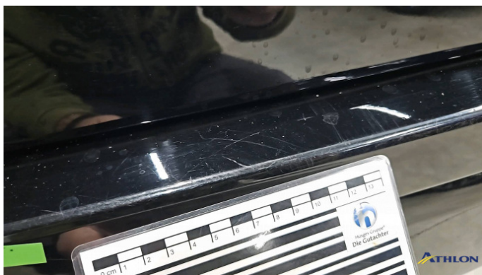
1. Stoßfänger Hinten Kratzer