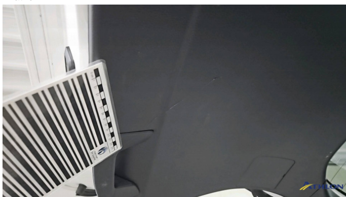
4. Heckdeckelverkleidung Kratzer