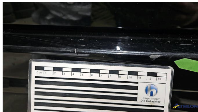
1. Stoßfänger Hinten Kratzer