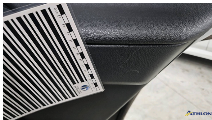
5. Türverkleidung Hinten - Rechts Kratzer