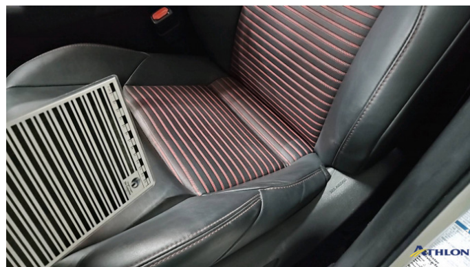
7. Sitz - Vorne - Links Gebrauchsspuren