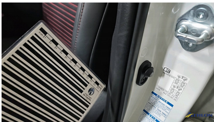
6. Türdichtung Vorne - Links Gebrauchsspuren